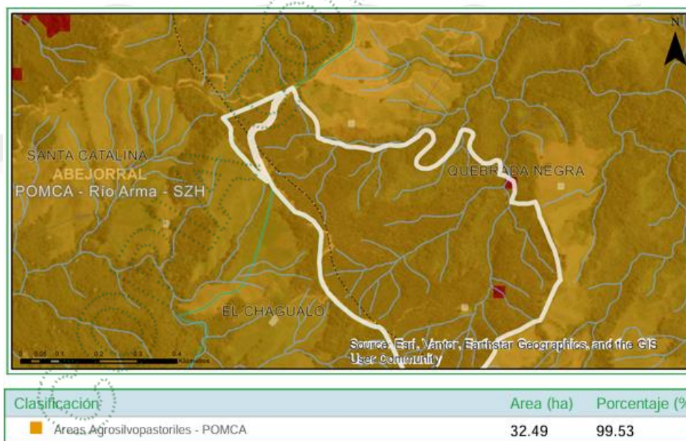
Imagen 2. Zonificación ambiental del predio FMI 002-12454.

El sitio donde se presenta la denuncia ambiental se encuentra al interior de los límites del Plan de Ordenación y Manejo de la Cuenca Hidrográfica POMCA del Rio Arma Resolución 112-0397 del 13/02/2019. Tal como se muestra en la imagen 2, el 99.53% del área del predio se encuentra dentro Áreas agrosilvopastoriles , las cuales se caracterizan por el desarrollo se dará con base en la capacidad de usos del suelo y se aplicará el régimen de usos del respectivo Plan de Ordenamiento Territorial (POT); así como los lineamientos establecidos en los Acuerdos y Determinantes Ambientales de Cornare que apliquen. La densidad para vivienda campesina será la establecida en el POT y para la vivienda campestre según el Acuerdo 392 de Cornare.