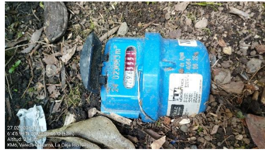
Imágenes relacionadas con las facturas generadas por el servicio del acueducto veredal.