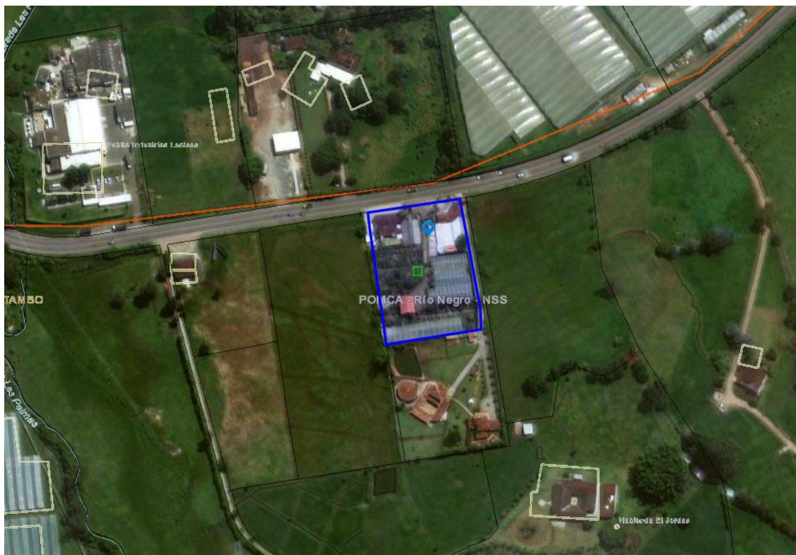
Imagen 1. Ubicación predio de interés

3.3 En cuanto a los individuos arbóreos de interés: Corresponden a flora exótica en medio de coberturas artificializadas, presentan óptimas condiciones generales. Durante la visita se realizó un recorrido por el área a intervenir con el fin de identificar los árboles objeto de solicitud, se tomaron puntos de ubicación geográfica y se realizaron mediciones dasométricas para revisar el inventario forestal entregado. Los árboles requeridos para aprovechamiento corresponden a: