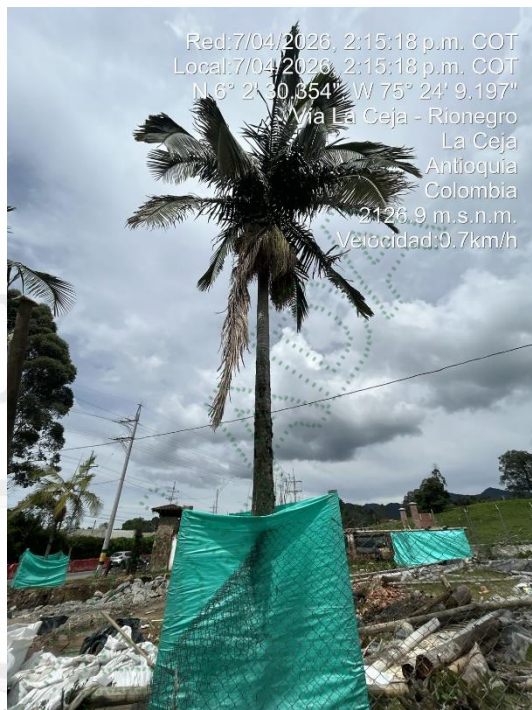
Imágenes 3 y 4. Árboles a intervenir