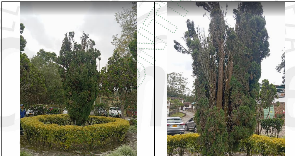
Imagen 3. Árboles objeto del aprovechamiento