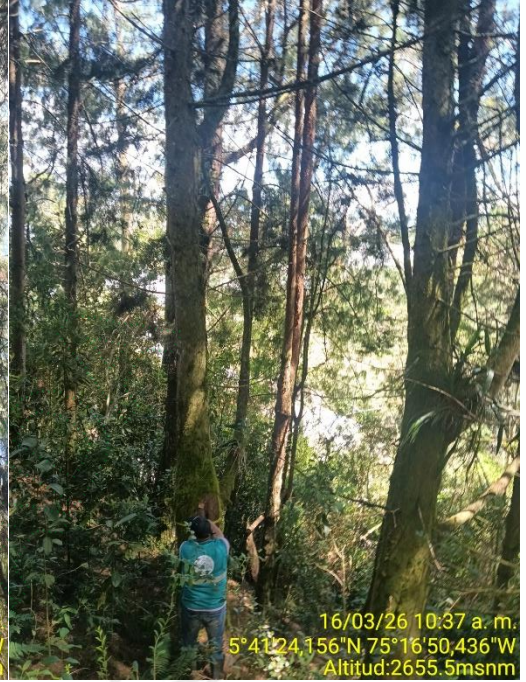
Árboles objeto de aprovechamiento derecha Cipres / centro e izquierda Patula