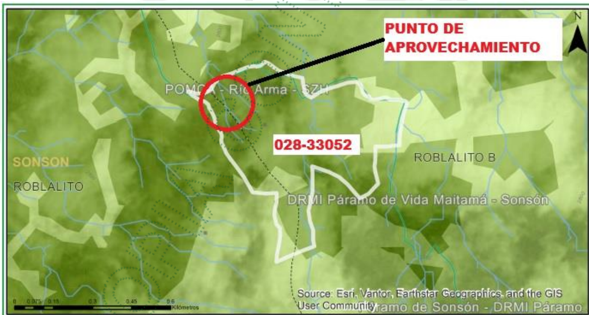
Localización del punto de aprovechamiento en el predio.

Los árboles están localizados en un área clasificada como Área de Importancia Ambiental y dentro de la zonificación tipo B de la Reserva Forestal Central, conforme a lo establecido en la Ley 2ª de 1959.