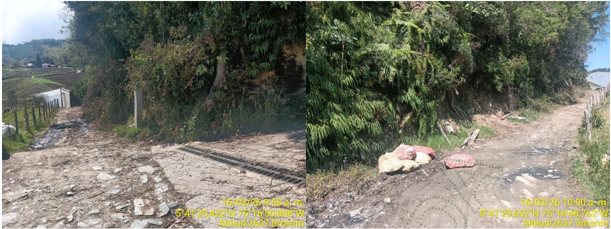
Izquierda partidas después de la escuela / Derecha punto de ingreso al predio.