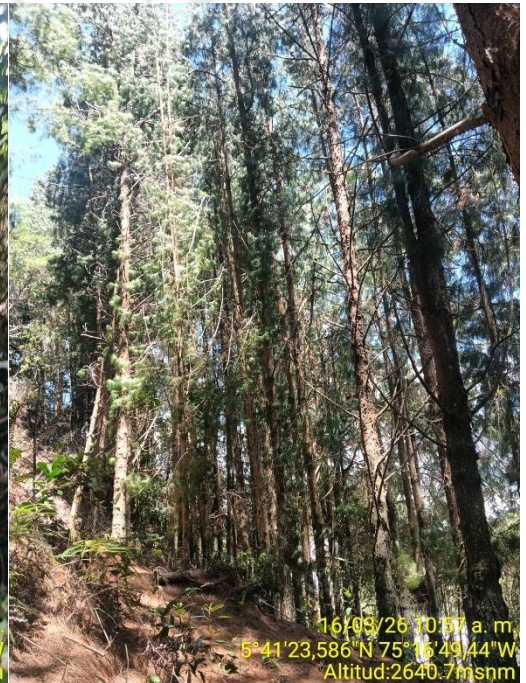
Árboles objeto de aprovechamiento derecha y centro Eucalyptos / izquierda Patula