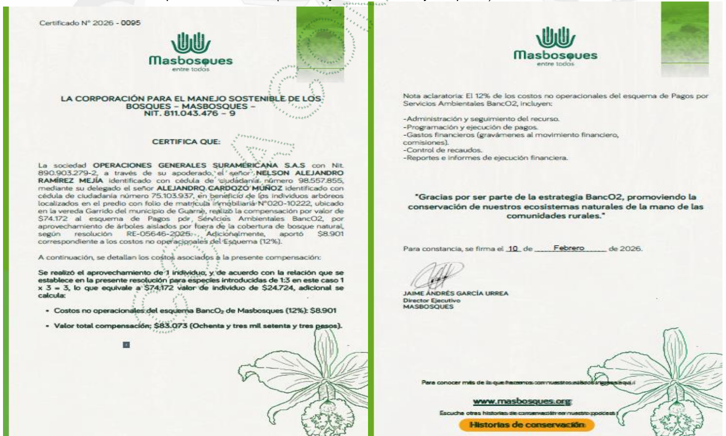
Imagen 3. Certificado PSA (Fuente radicado CE-03109-2026)