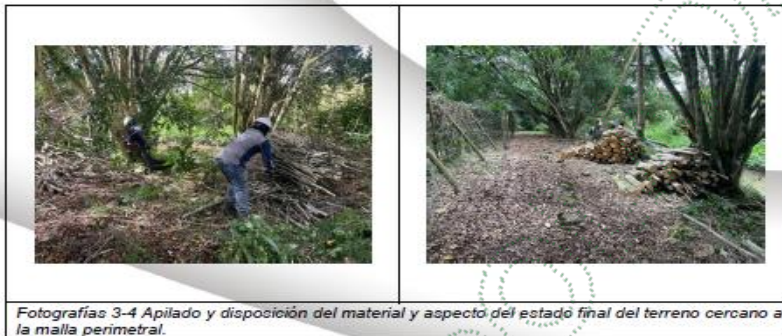
Fotografías 3-4 Apilado y disposición del material y aspecto del estado final del terreno cercano a la malla perimetral.