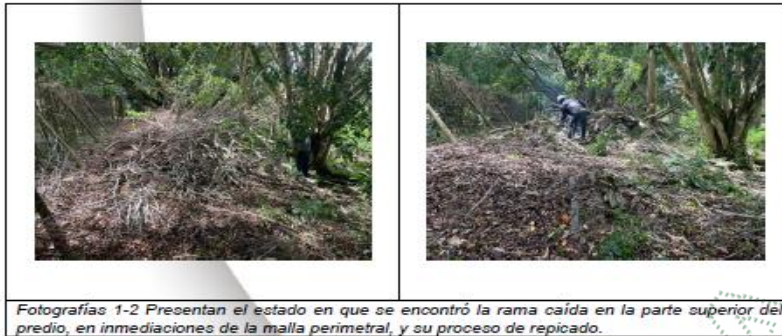
Fotografías 1-2 Presentan el estado en que se encontró la rama caída en la parte superior del predio, en inmediaciones de la malla perimetral, y su proceso de repicado.