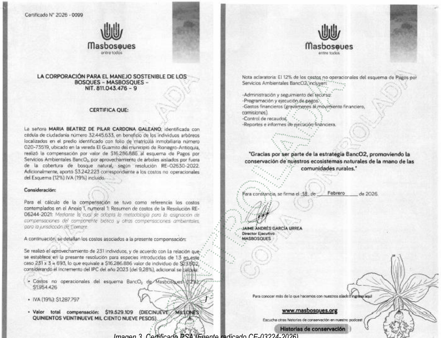
Imagen 3. Certificado PSA (Fuente radicado CE-03224-2026)