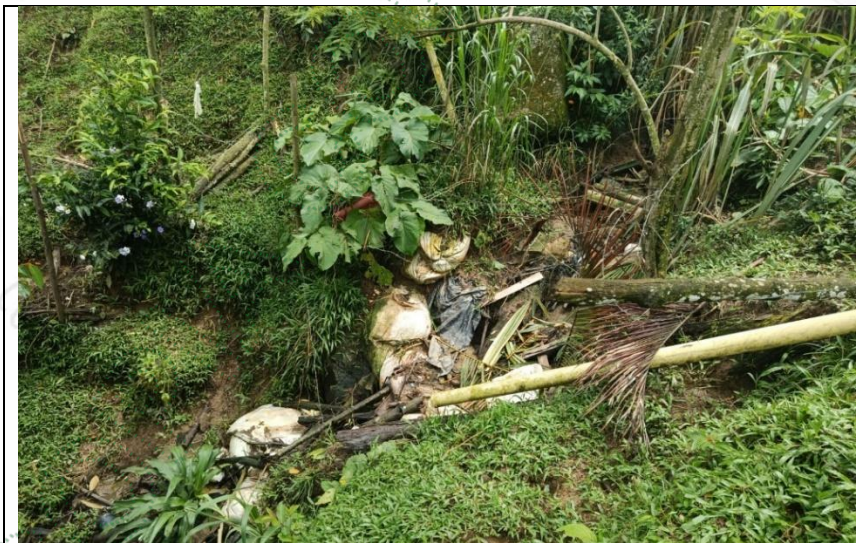
Imagen5. Punto de vertimiento N°2. Cornare 2026.