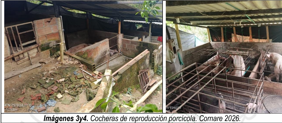
Imágenes 3y4. Cocheras de reproducción porcícola. Cornare 2026.