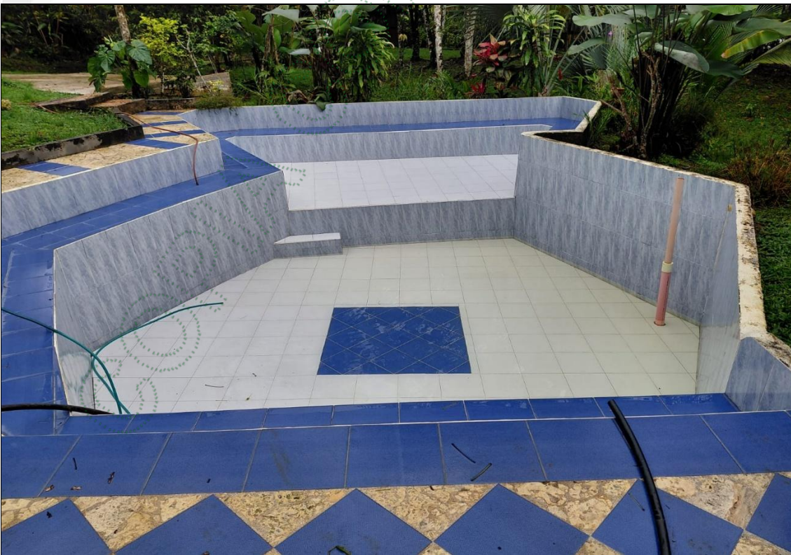
Imagen6. Piscina predio

En cuanto al uso recreativo, este se encuentra asociado a una piscina localizada dentro del predio descrito anteriormente. La estructura presenta geometría no definida, por lo tanto, se define que se toma las medidas de una piscina de forma rectangular con unas dimensiones de 9.1 metros de largo X 3.3 metros de ancho y 1.15 metros de profundidad. Con base en estas dimensiones, la piscina tiene un volumen total aproximado de 34.53m 3 , equivalente a 34.534 litros, destinada al uso recreativo de los habitantes y visitantes del predio.