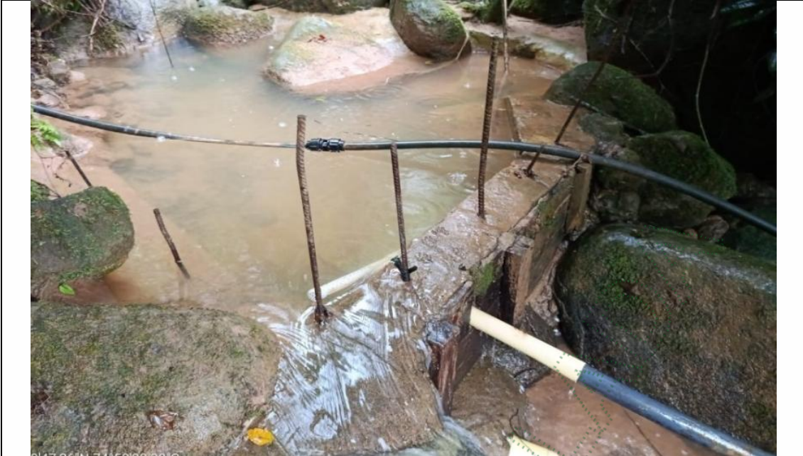
Imagen2. Captación del recurso hídrico. Cornare 2026

3.5 El agua conducida desde la obra de captación llega a un tanque desarenador con capacidad aproximada de 500 litros, localizado en el punto con coordenadas geográficas X: 74°58'36.03" O, Y: 05°59'42.51" N, Z: 769 msnm, al cual ingresa mediante tubería de 1.5 pulgadas de diámetro, permitiendo la sedimentación de partículas y material en suspensión antes de su distribución hacia el sistema de almacenamiento. Este tanque cuenta con una tubería de 2 pulgadas destinada a la limpieza y purga de sedimentos acumulados. Desde el desarenador se derivan dos líneas de conducción en tubería de 1.5 pulgadas y 3 pulgadas de diámetro, las cuales conducen el agua hacia tres tanques IBC de almacenamiento con capacidad de 1.000 litros cada uno; dichos tanques se encuentran interconectados mediante tuberías de rebose, lo que permite mantener el equilibrio en los niveles de agua y garantizar el almacenamiento y distribución del recurso hídrico para los diferentes usos domésticos y recreativos del predio. (Imagen3).