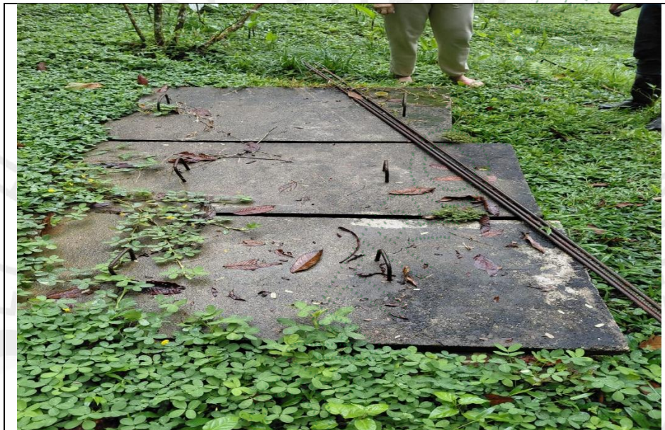
Imagen7. Pozo séptico

3.8 Se verificaron las condiciones del sistema de tratamiento de aguas residuales, localizado en el punto con coordenadas geográficas X: 74°58'37.90" W, Y: 05°59'37.60" N, Z: 762 msnm, donde se identificó una estructura en mampostería correspondiente al tanque del sistema, con dimensiones aproximadas de 1.20 m ancho x 2 m de largo, así como una trampa de grasas con dimensiones aproximadas de 0.60 m x 0.60 m. No obstante, durante la visita no fue posible establecer la profundidad ni la capacidad volumétrica de ambas estructuras. Durante la inspección no se percibieron olores ofensivos ni evidencias de rebose superficial, lo que permite inferir un funcionamiento aparentemente adecuado al momento de la visita. Según lo informado por la señora María Adalgiza, se le realiza mantenimiento aproximadamente cada dos años.