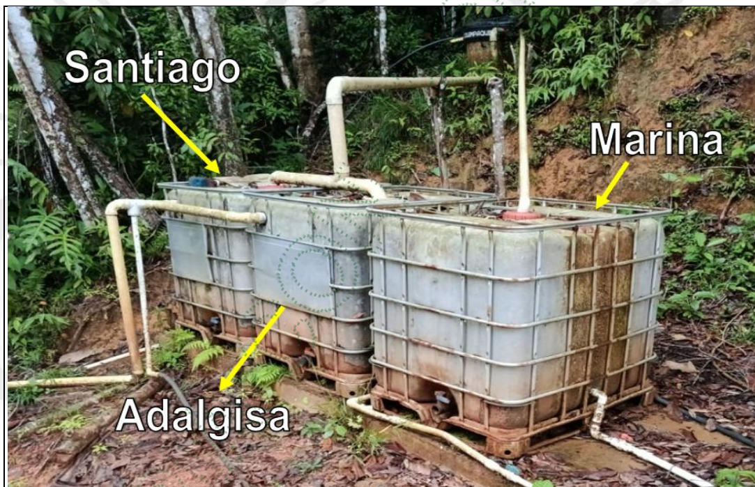
Imagen4. Tanques de almacenamiento. Cornare 2026