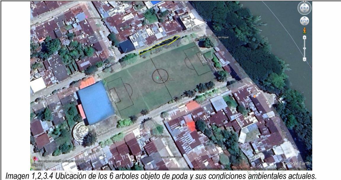
Imagen 1,2,3,4 Ubicación de los 6 arboles objeto de poda y sus condiciones ambientales actuales.