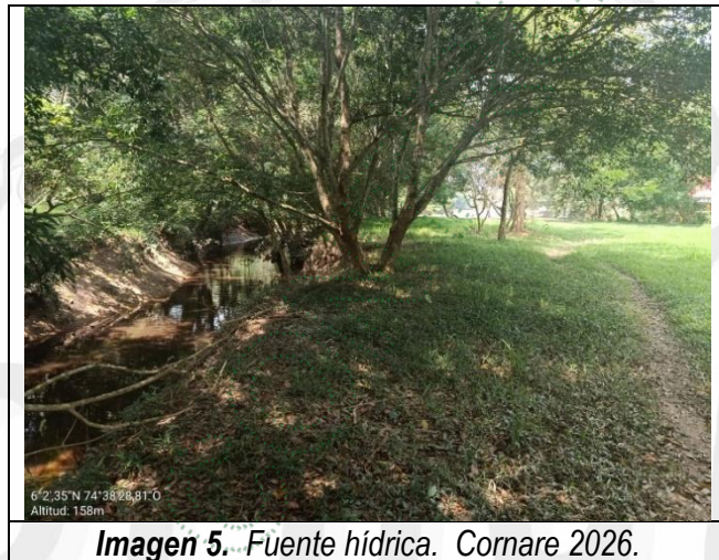
Imagen 5. Fuente hídrica. Cornare 2026.