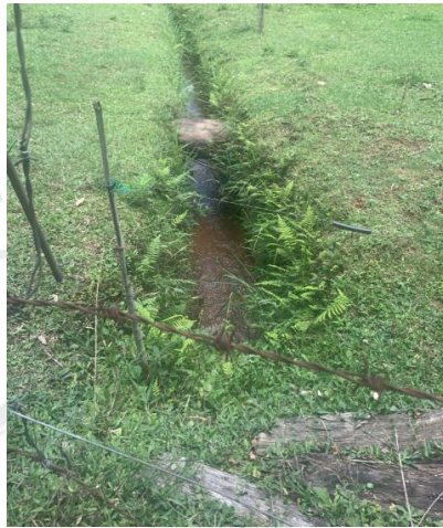
Fuente en predio vecino

Otras situaciones encontradas en la visita: N.A