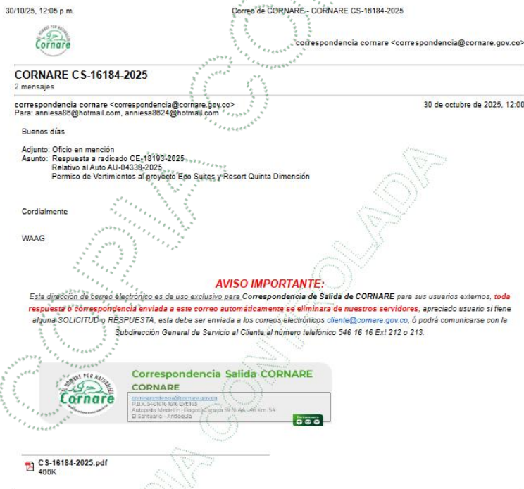
IMAGEN 2 Notificación

Las actuaciones administrativas mencionadas fueron formuladas con el propósito de dar continuidad y viabilidad al trámite ambiental; sin embargo, a la fecha no se evidencia respuesta por parte del interesado a los requerimientos realizados, pese a que la Corporación efectuó la solicitud de información complementaria