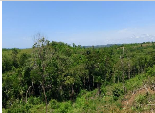
Imagen 4. Condiciones ambientales actuales del predio 25 de septiembre del 2025