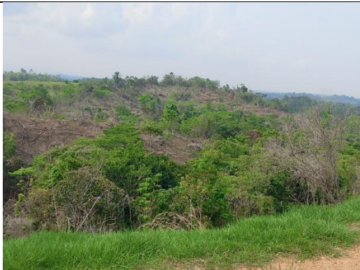
Imagen 3. Condiciones ambientales del predio en el momento de su intervención marzo del 2025