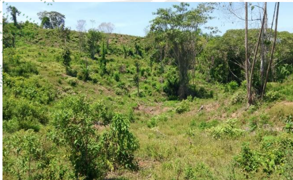
Imagen 1,2 , condiciones ambientales del área objeto de tala rasa y quema.