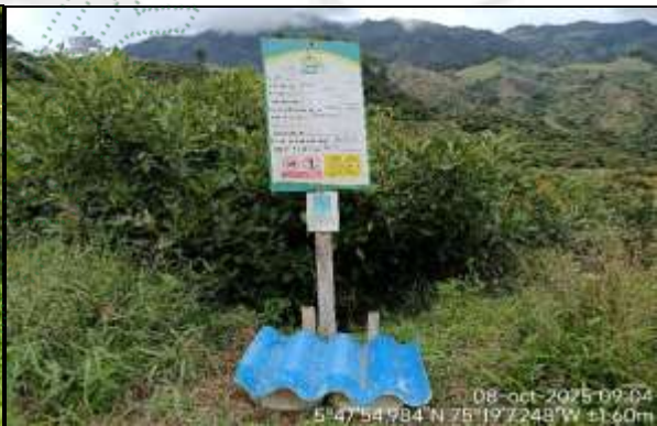
Zona de desinfección