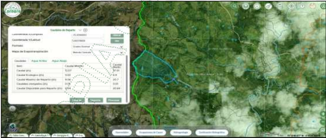
Caudal de reparto Quebrada El Tesoro