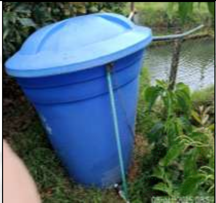
Tanques de almacenamiento