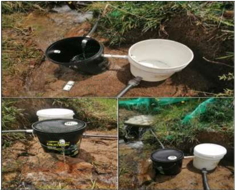
Ejemplo de obra control de caudal económica (diseño)

Que el artículo 79 de la Carta Política indica que: “Todas las personas tienen derecho a gozar de un ambiente sano. La Ley garantizará la participación de la comunidad en las decisiones que puedan afectarlo.