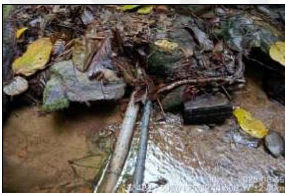
Área de captación