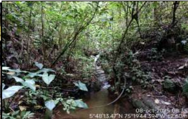
Cobertura vegetal fuente hídrica El Tesoro