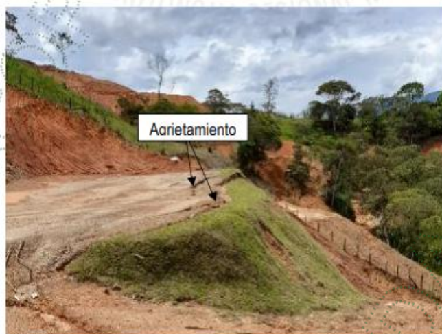
Foto 6. Agrietamiento en zona de formación de movimiento en masa o cárcava.