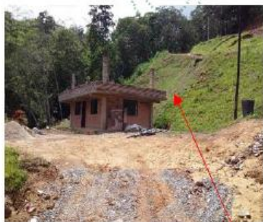
Imagen 4: Revestimiento de taludes