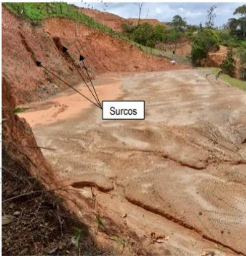
Foto 4. Formación en surcos en taludes sin revegetalización.

Por otro lado, es importante anotar que todo el predio evidenció procesos de inestabilidad tales como: una cárcava activa, formación de surcos y una zona de agrietamiento, como se muestra desde la Foto 4 hasta la Foto 6. Es significativo indicar que los cuatro lotes se encuentran sobre suelo residual y llenos antrópicos con textura areno limosa, los cuales presentan características drenantes, lo que los hace susceptibles a la formación de procesos de remoción en masa debido a la facilidad de infiltración de las aguas lluvias.