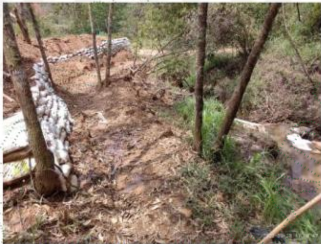
Foto 3. Actividades en la ronda hídrica de la quebrada La Emé.

En el lote 4, además, se observó la presencia de un muro en costales o bolsacreto, ubicados sobre la llanura de inundación de la fuente hídrica, como se muestra a continuación: