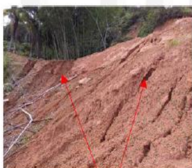
Imagen 1: Erosión tipo Surcos