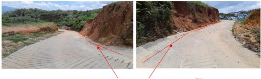
Imágenes de los canales realizados para conducción de aguas lluvia.