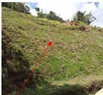
Imagen 5: Cunetas perimetrales y trinchos