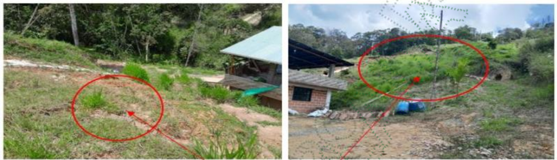
Imágenes de los trabajos realizados, en los taludes para prevenir pérdidas de suelo.

Se evidenció el aislamiento de algunas fajas de retiro de la fuente hídrica, y la siembra de algunos individuos vegetales sobre la ronda hídrica.