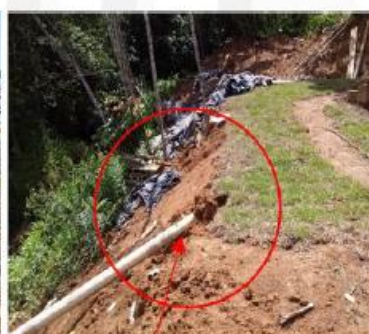
Imagen 3: Movimiento laminar