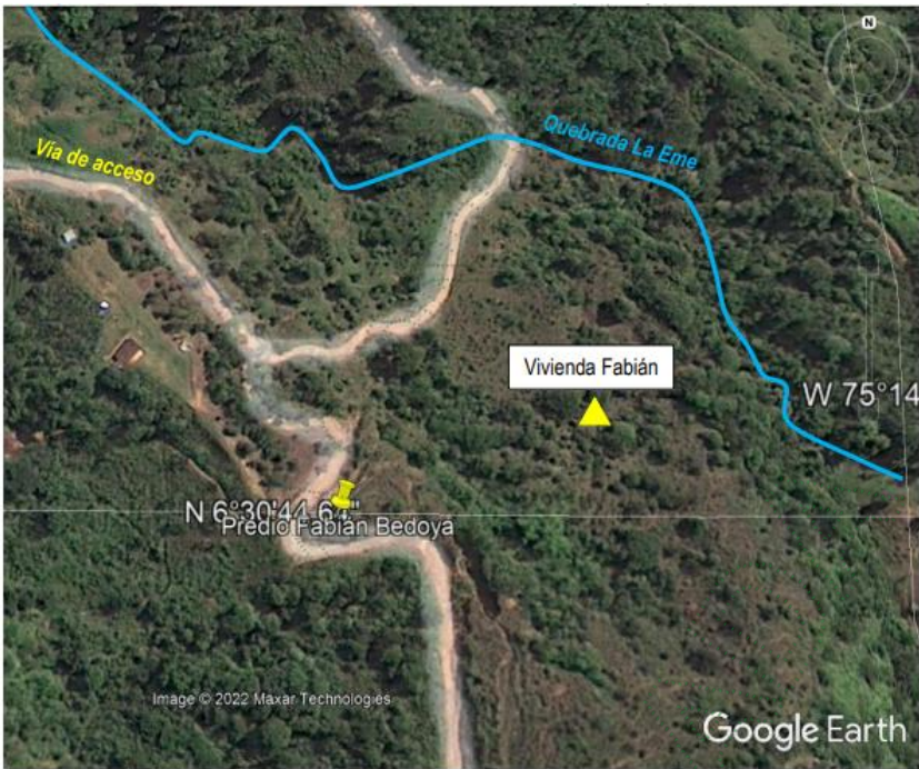
Figura 1. Localización de la zona de estudio.