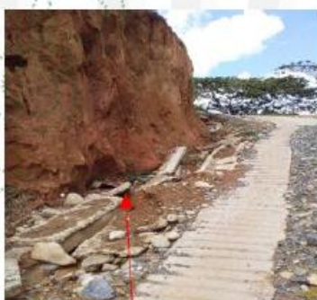
Imagen 2: Cunetas destruidas