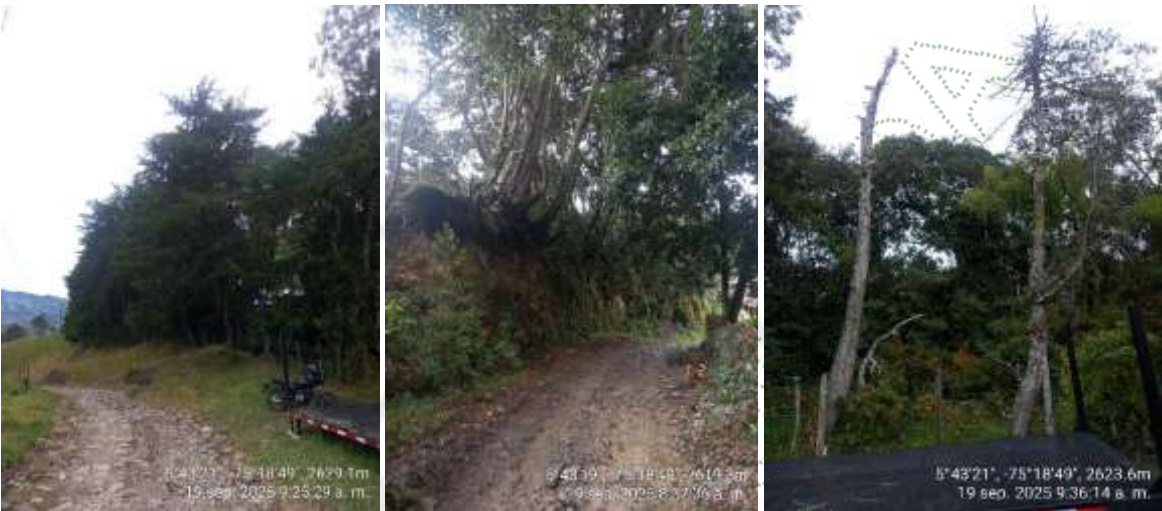
Imagen 2. Árboles objeto de la solicitud en el cerco vivo.