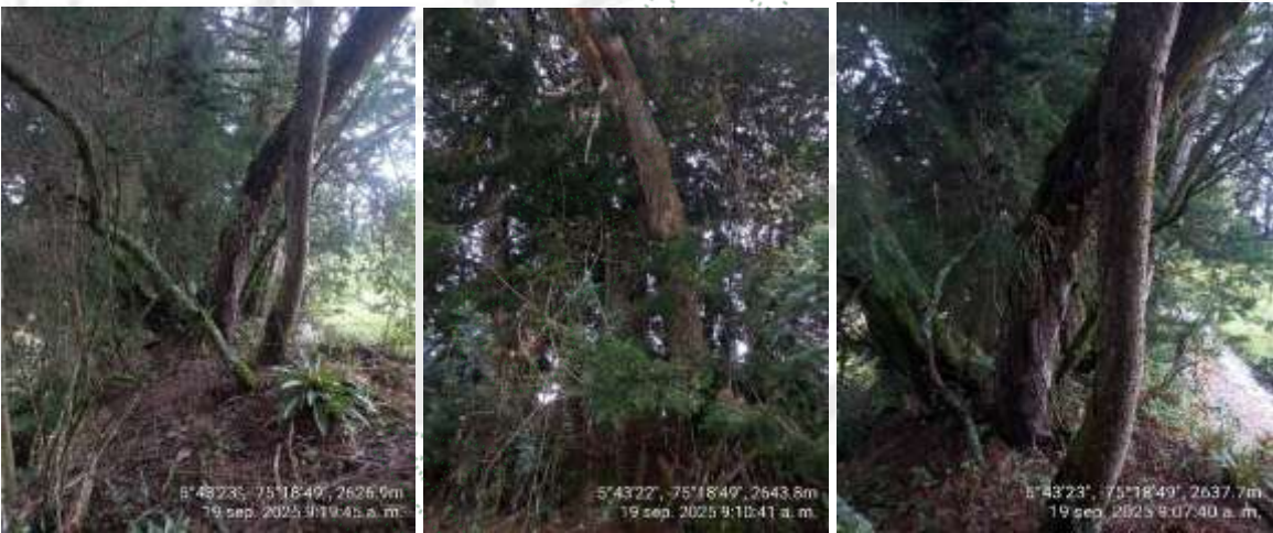
Imagen 3. Árboles objeto de la solicitud en el rodal objeto del aprovechamiento.

4.3 Viabilidad: Técnicamente se considera VIABLE EL APROVECHAMIENTO FORESTAL DE ÁRBOLES AISLADOS, en el predio identificado con FMI: 028-20503, ubicado en la vereda Río Arriba del municipio de Sonsón, para las siguientes especies: