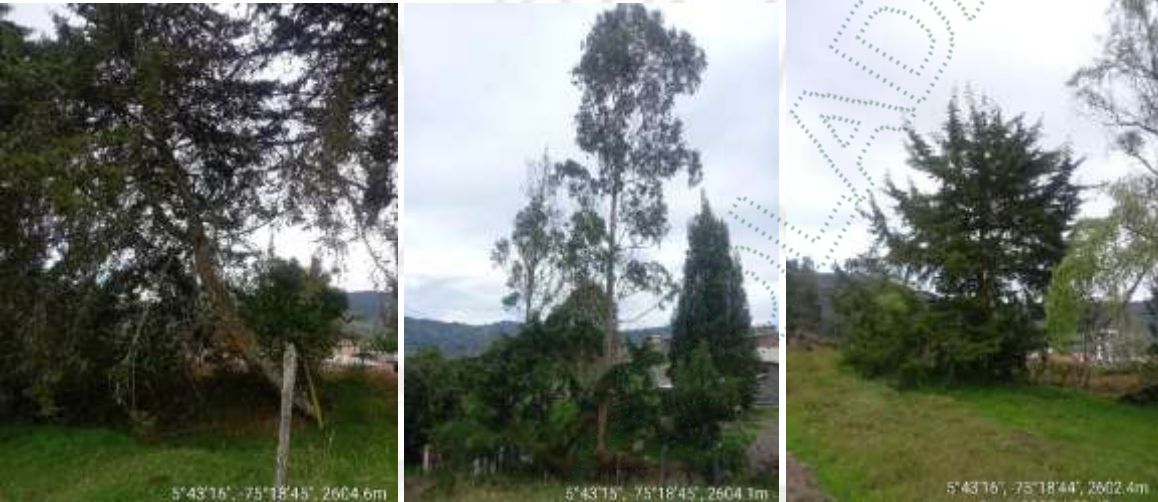
Imagen 2. Arboles objeto de aprovechamiento autorizados en mediante la Resolución RE-01586-2024.