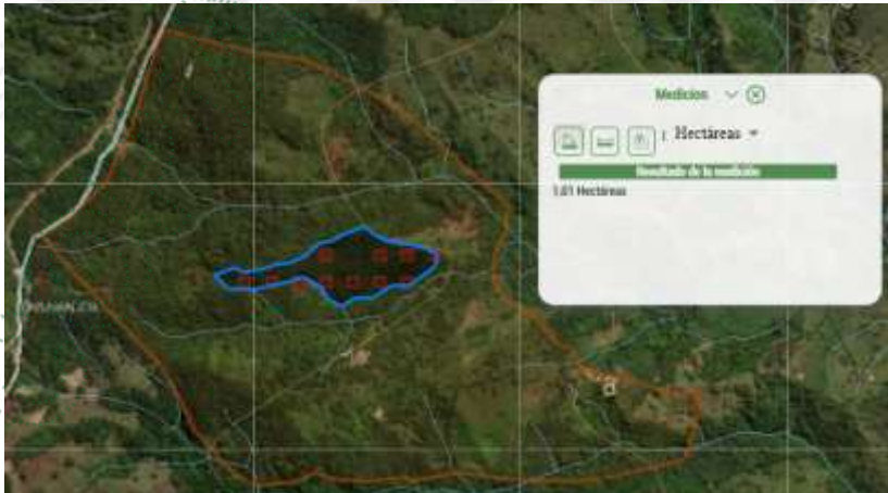
Imagen 1. Mapa del predio de interés, en azul el polígono donde se encontró la zona de quema

Descripción sucinta de lo manifestado por el usuario en la queja: “Durante visita de campo en la vereda Tabanales, municipio de Argelia, se identificó una a irregularidad ambiental atribuida a un beneficiario del programa Banco2. Según los informan el propietario realizó una quema con el argumento de eliminar abejas; sin embargo, la evidencia indicó aprovechamiento del terreno. En la inspección se encontró un lote quemado, cercado y con siembra reciente de pasto de corte, lo cual confirma cambio de uso del suelo hacia fines ganaderos en su área protegida por banco2.”