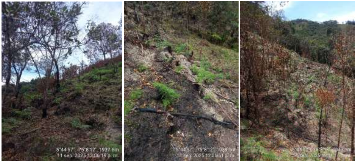
Imagen 2. Fotos de algunas áreas afectadas por la quema

La composición florística refleja una clara dominancia de A. lepidotus , especie característica de procesos de regeneración secundaria en ecosistemas andinos. La elevada frecuencia de individuos juveniles y la baja diversidad de especies evidencian un estado sucesional temprano a intermedio. La quema interrumpió este proceso, afectando la recuperación de la cobertura vegetal y la estabilidad del suelo. De acuerdo con la Circular CIR-00031-2024, la mayoría de los individuos registrados corresponden a latizales (2,5–10 cm de DAP), que pueden provenir de regeneración natural o de plantaciones, y cuyo eventual corte se considera rocería, sin requerir trámite de aprovechamiento forestal.