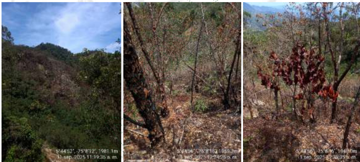
Imagen 3. Fotos del área del derrumbe

La composición florística refleja una clara dominancia de A. lepidotus , especie característica de procesos de regeneración secundaria en ecosistemas andinos. La elevada frecuencia de individuos juveniles y la baja diversidad de especies evidencian un estado sucesional temprano a intermedio. La quema interrumpió este proceso, afectando la recuperación de la cobertura vegetal y la estabilidad del suelo. De acuerdo con la Circular CIR-00031-2024, la mayoría de los individuos registrados corresponden a latizales (2,5–10 cm de DAP), que pueden provenir de regeneración natural o de plantaciones, y cuyo eventual corte se considera rocería, sin requerir trámite de aprovechamiento forestal.