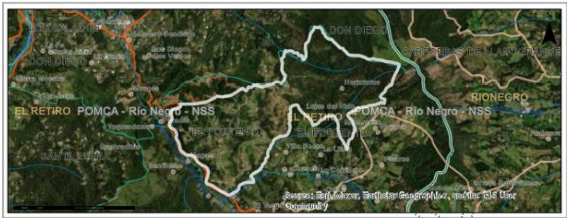
Imagen 1. Ubicación del predio de interés

De acuerdo con el inventario forestal presentado con la solicitud y verificado en campo, los árboles objeto de aprovechamiento corresponden ciento cinco (105) individuos de la especie Pinus patula ( Pinus patula ), los cuales presentan una distribución uniforme, lo que representa que hacen parte de una plantación forestal, que fue sembrada en el año 2013, conforme se manifiesta en el documento técnico anexo a la solicitud “INVENTARIO FORESTAL PARA EL APROVECHAMIENTO DE ESPECIES INTRODUCIDAS LOTE 195 PARCELACION HORIZONTES EL RETIRO, ANTIOQUIA”,