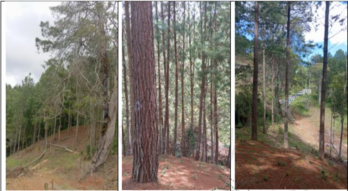
Imagen 3. Árboles objeto del aprovechamiento

4.1 Viabilidad: Técnicamente se considera VIABLE el APROVECHAMIENTO FORESTAL DE ÁRBOLES AISLADOS , en beneficio del predio identificado No. 017-85007, ubicado la Parcelación “Horizonte Territorio Campestre”, vereda El Portento, en el municipio de El Retiro, Antioquia, para las siguientes especies: