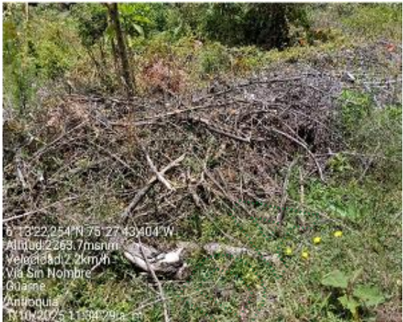
Imagen 15 - 20. Foco de aprovechamiento tocones y disposición de los restos de residuos vegetales.

En virtud de lo anterior, se verifica el cumplimiento de las obligaciones adquiridas en la Resolución No. RE-05185-2023 del 11 de diciembre de 2023.: