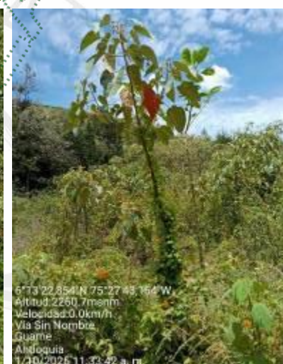
Imagen 9 - 14. Compensación realizada con la siembra de árboles nativos en el predio.