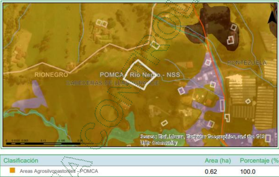
Imagen 2. Determinantes predio de interés

3.4 Localización de los árboles aislados a aprovechar con respecto a Acuerdos Corporativos y al Sistema de Información Ambiental Regional: De acuerdo con el Sistema de Información Geográfica de Cornare, el predio de interés se encuentra al interior de los límites del Plan de Ordenación y Manejo de la Cuenca Hidrográfica POMCA del Río Negro, aprobado en Cornare mediante la Resolución No. 112-7296 del 21 de diciembre de 2017 y mediante la Resolución No. 112-4795 del 8 de noviembre de 2018; estableció el régimen de usos, además, por medio de la resolución RE-04227-2022 del 1 de noviembre de 2022 se modifica el régimen de usos al interior. Obteniendo para la zona de interés: áreas agrosilvopastoriles.