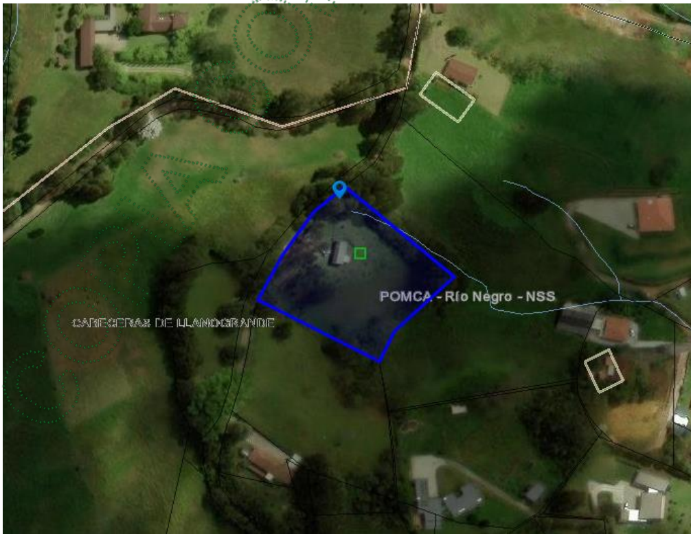
Imagen 1. Ubicación predio de interés

3.2 En cuanto al predio donde se ubican los árboles de interés: Se encuentra ubicado en la vereda Cabeceras de Llanogrande del municipio de Rionegro, presenta un paisaje de montaña con un relieve de filas y vigas. El objetivo del aprovechamiento es realizar el reemplazo de estos árboles por especies nativas.