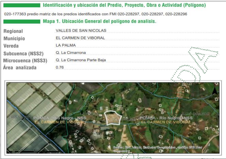
Imagen 1. Ubicación predio matriz 020-177363, del que se deriva el predio con FMI 020-228296

Para el tratamiento de las aguas residuales domésticas de la vivienda se tiene sistema séptico en material prefabricado.