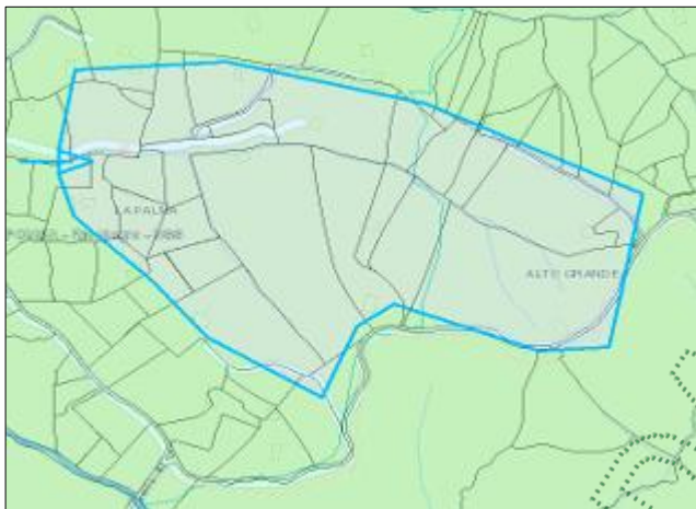
Imagen 3. Área de captación Q. La Palma

La parte interesada, adjunto con la solicitud hace entrega de la Autorización Sanitaria expedida por la Secretaría de salud e Inclusión Social con radicado*2025060166404* del 9 de abril de 2025, en la cual en su Artículo Primero Autorización Sanitaria Favorable de concesión de aguas para consumo humano de la fuente denominada Quebrada La Palma, ubicada en la vereda la Palma del municipio de El Carmen De Viboral.