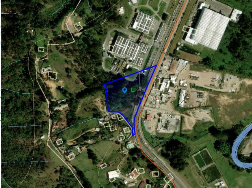
Imagen 1. Ubicación predio de interés

3.2 En cuanto al predio donde se ubican los árboles de interés: Se encuentra ubicado en la vereda La Laja del municipio de Rionegro, presenta un paisaje de altiplanicie con un relieve de lomas y colinas, además, hace parte de un corredor suburbano conforme el POT del municipio. El objetivo del aprovechamiento es evitar accidentes y daños a la infraestructura ya que previamente se presentó el desprendimiento una rama que hizo daños en los techos.