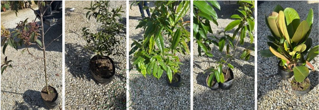
Tabla 1. Cantidad de individuos por especie.

25.1.1. La compensación ambiental referente a los individuos arbóreos autorizados que NO presentaban veda fue realizada a través de la siembra de quince (15) individuos arbóreos de las especies (Tabla 1): Arrayán ( Myrcia popayanensis ), Aceite de María ( Calophyllum brasiliense ), Chagualo ( Clusia rosea ), Niguito ( Miconia sp. ), y Olivo de cera ( Morella funckii ).