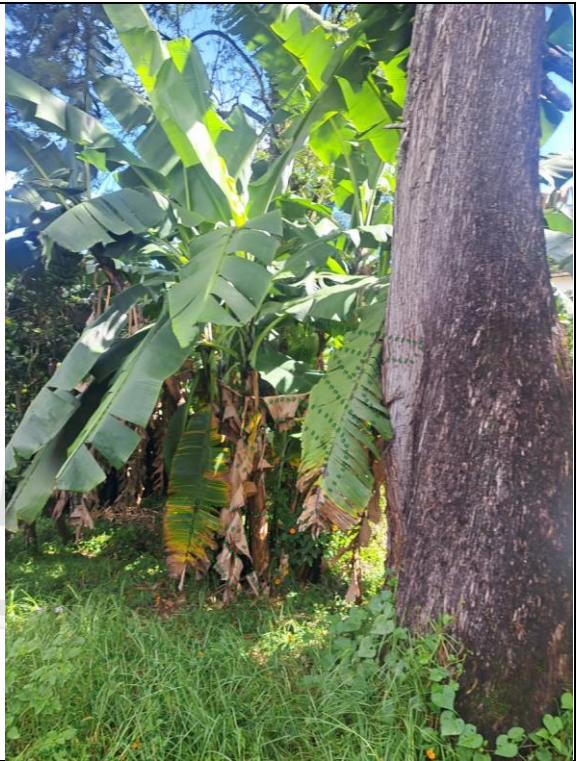
Base del árbol