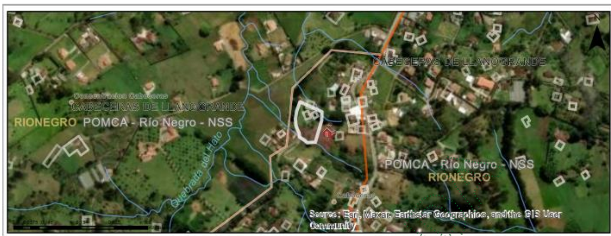
Imagen 1. Ubicación del predio de interés 020-2816

De acuerdo con la información que reposa en la solicitud, los árboles objeto de aprovechamiento corresponden a un (1) individuo de Ciprés ( Cupressus lusitánica ), el cual los cuales se encuentran conformando un pequeño rodal de 1.72 hectáreas, con diámetros promedios de 0.0000830 metros y un altura promedio de 25 metros, los árboles de interés son individuos maduros, algunos presentan inclinaciones marcadas, y secamiento en ramas, el propósito del aprovechamiento es para uso de la madera al interior de los predios.