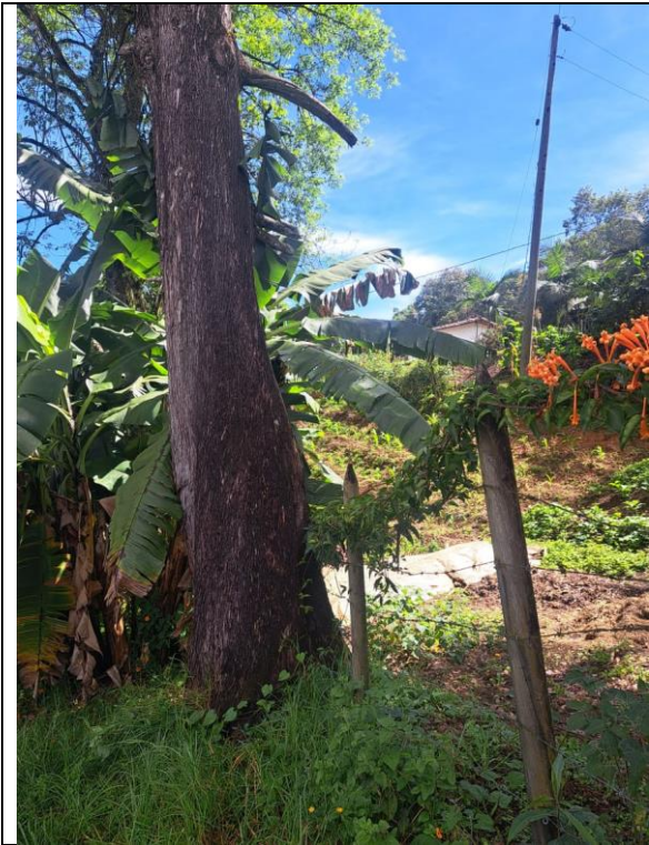
Cercanía al lindero