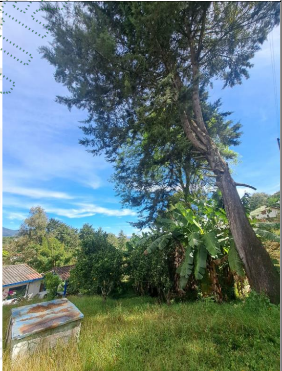
Inclinación hacia la casa