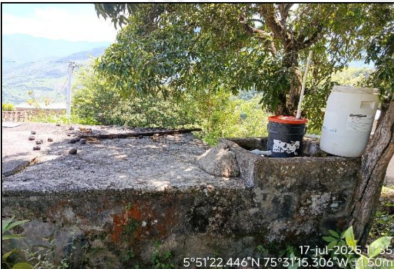
Tanque de almacenamiento

La obra de captación y control de pequeños caudales se encuentra instalada sobre un tanque de almacenamiento en cemento con capacidad de 4800 L, el cual cuenta con sistema de control de flujo. Se verifico que la obra cumpliera con las medidas establecidas en los diseños entregados, el tubo de entrada al sistema es de ½ pulgada con llave de paso, en la primera caneca se encuentra instalado flotador automático como sistema de control de flujo, el tubo de conexión a la segunda caneca es de ½ con un tapón perforado, garantizando el suministro del caudal otorgado.