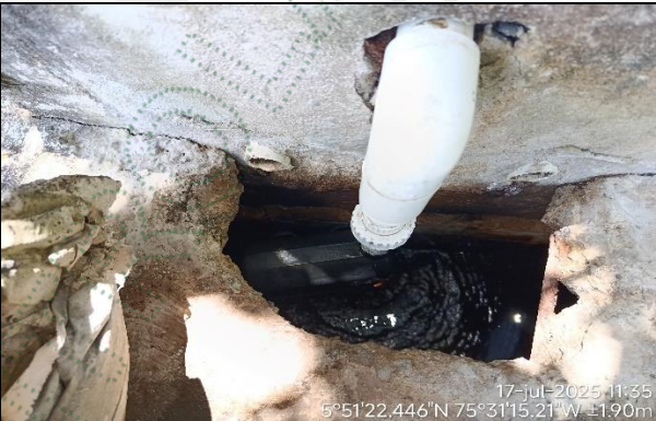
Flotador tanque de almacenamiento