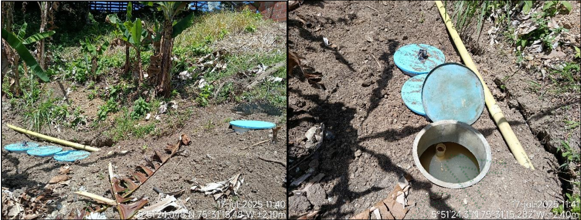
Sistema de tratamiento de aguas residuales domésticas.