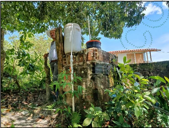
Obra de captación y control de pequeños caudales