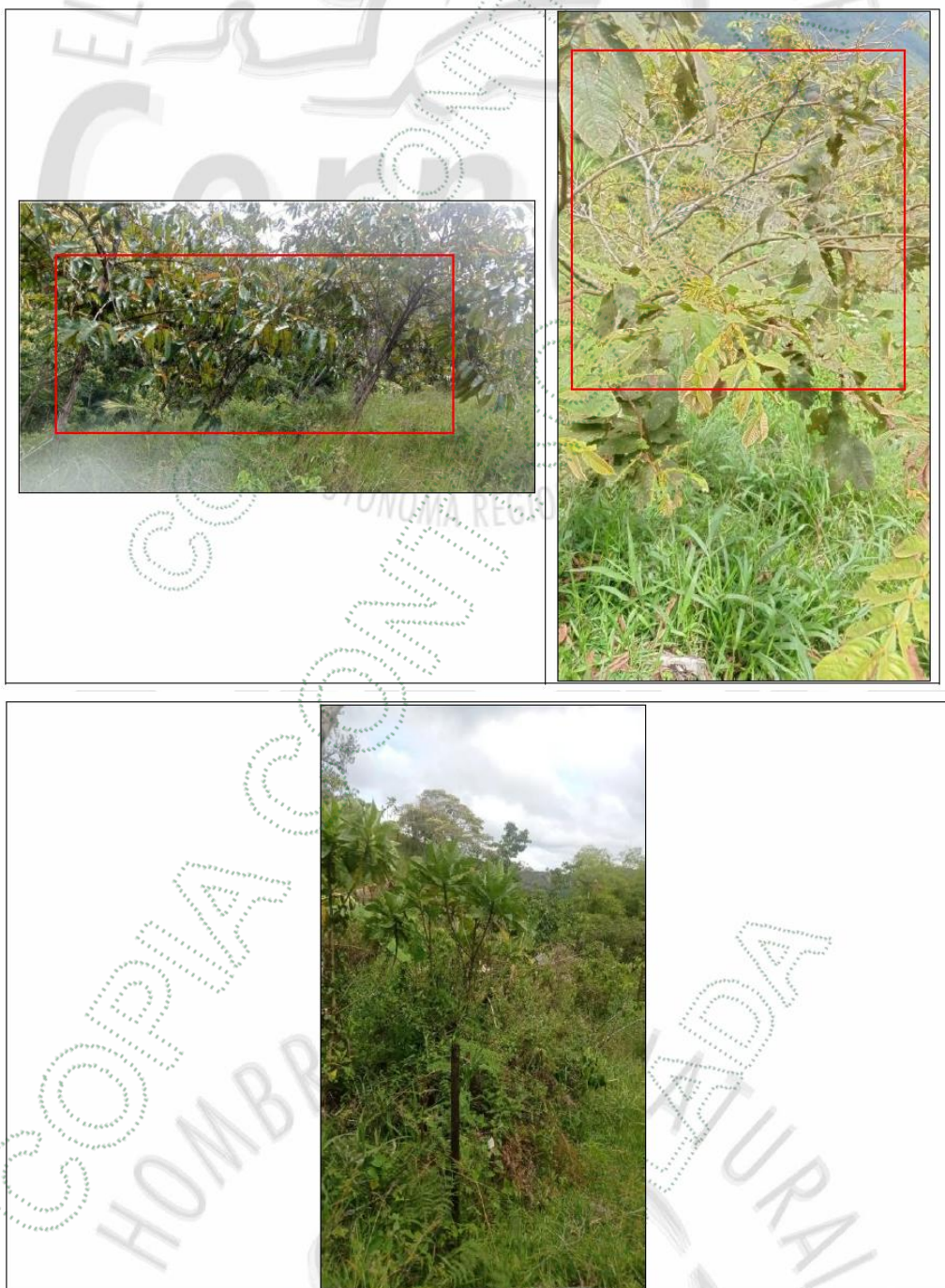
Imagen 2. Estado actual de árboles sembrados.

obstante, el señor Jairo asegura haber ejecutado las acciones requeridas e incluso haber informado personalmente en la sede sobre la implementación de dichas medidas.