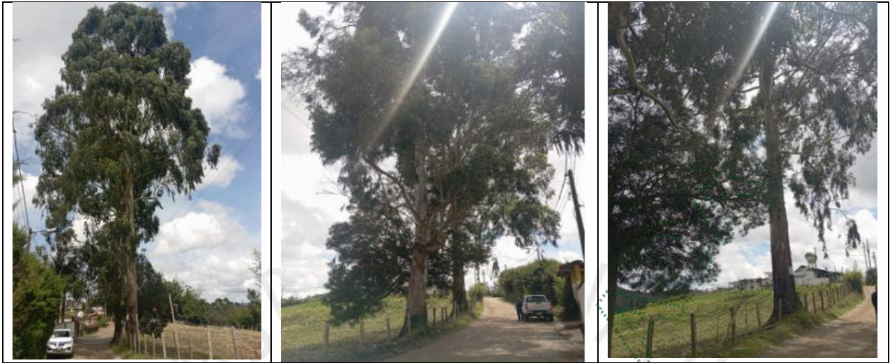
Imagen 3. Árboles objeto del aprovechamiento

4.1 Viabilidad: Técnicamente se considera VIABLE el APROVECHAMIENTO FORESTAL DE ÁRBOLES AISLADOS , en beneficio del predio identificado con Folio de Matrícula Inmobiliaria 018-65505 ubicado en Vereda Chocho Mayo del municipio de Marinilla - Antioquia, para las siguientes especies: