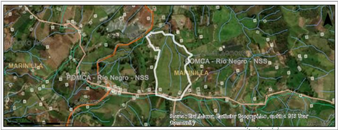
Imagen 1. Ubicación del predio de interés

Los árboles de interés corresponden a tres (3) individuos de la especie Eucalipto ( Eucalyptus sp), los cuales se ubican en cerca del lindero con la vía, dichos individuos son maduros de su especie, y según el interesado han presentado en varias ocasiones desprendimiento de ramas, sobre la vía, lo que genera un riesgo para la comunidad y vehículos que hacen uso constante de la vía rural.