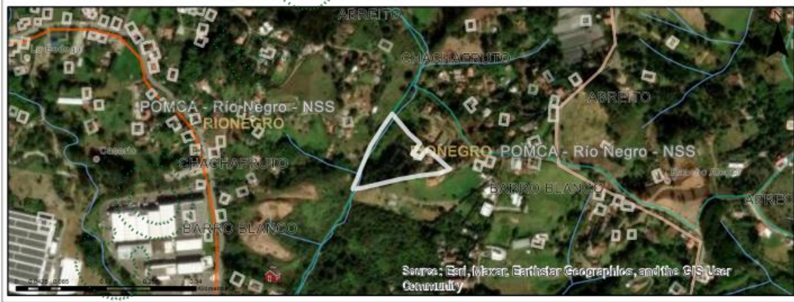
Imagen 1: Ubicación del predio de interés

De acuerdo con el Sistema de Información Geográfica de Cornare, el predio de interés con Folio De Matrícula Inmobiliaria No. 020-25270, PK 6152001000001600266, con un área de 1,17 ha, se ubica en la vereda Barro Blanco del municipio de Rionegro. El Predio presenta coberturas en pastos, y un rodal de Ciprés, en un paisaje de altiplanicie y relieve en vallecitos. (Imagen 1.)