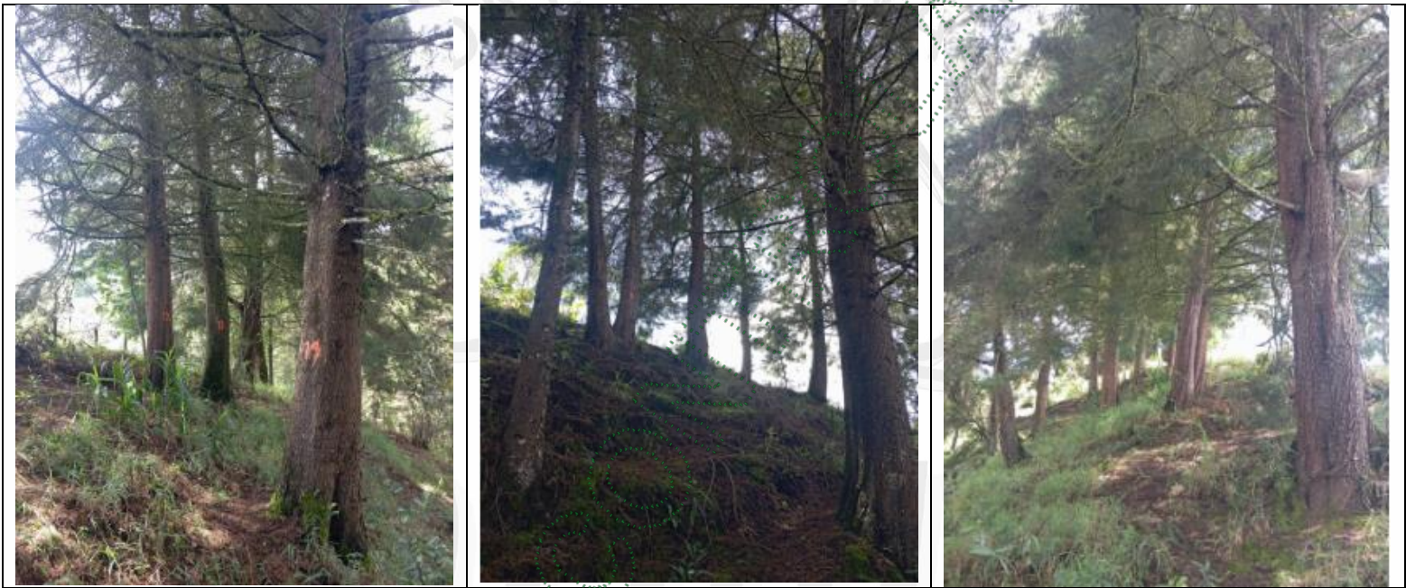
Imagen 3. Árboles objeto del aprovechamiento

4.1 Viabilidad: Técnicamente se considera VIABLE el APROVECHAMIENTO FORESTAL DE ÁRBOLES AISLADOS POR FUERA DE LA COBERTURA DE BOSQUE NATURAL , en beneficio del predio identificado con el Folio de Matricula Inmobiliaria 020-25270, localizado en la zona rural, vereda Barro Blanco del municipio de Rionegro, para las siguientes especies: