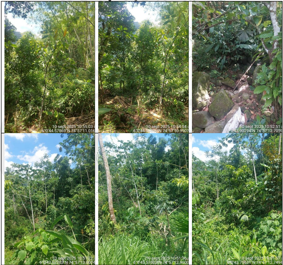
Figura 2. Regeneración natural