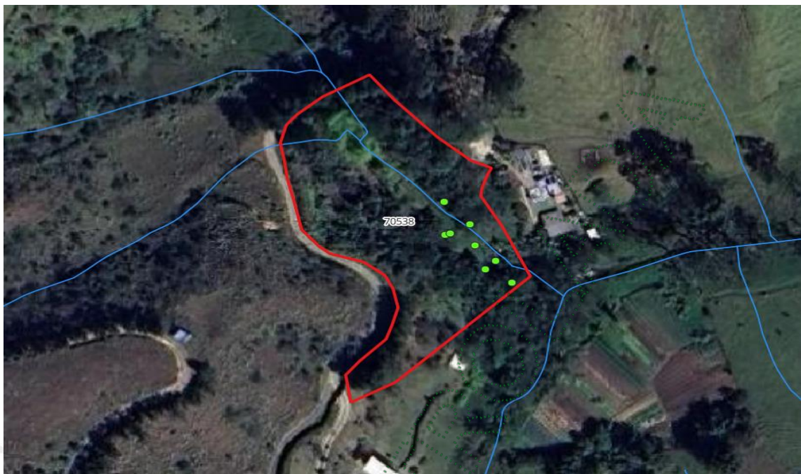
Predio y ubicación de los sitios de siembra.