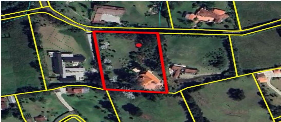
Imagen 1. Ubicación predio de interés

3.2 En cuanto al predio donde se ubican los árboles de interés: Se encuentra ubicado en la vereda Los Salados del municipio de El Retiro, presenta un paisaje de montaña con un relieve de filas y vigas, además, hace parte del polígono de parcelación conforme el POT de municipio. El objetivo del aprovechamiento es prevenir el riesgo frente a la infraestructura vecina y al interior del mismo lote por altura y condiciones generales de los árboles.