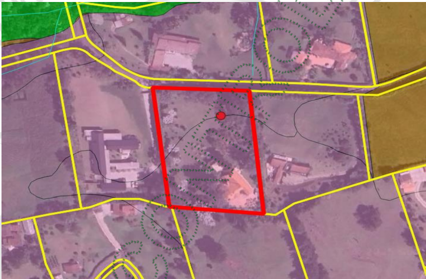
Imagen 2. Determinantes predio de interés

3.4 Localización de los árboles aislados a aprovechar con respecto a Acuerdos Corporativos y al Sistema de Información Ambiental Regional: De acuerdo con el Sistema de Información Geográfica de Cornare, el predio de interés se encuentra al interior de los límites del Plan de Ordenación y Manejo de la Cuenca Hidrográfica POMCA del Río Negro, aprobado en Cornare mediante la Resolución No. 112-7296 del 21 de diciembre de 2017 y mediante la Resolución No. 112-4795 del 8 de noviembre de 2018, estableció el régimen de usos, además, por medio de la resolución RE-04227-2022 del 1 de noviembre de 2022 se modifica el régimen de usos al interior. Obteniendo para la zona de interés: áreas de uso múltiple.