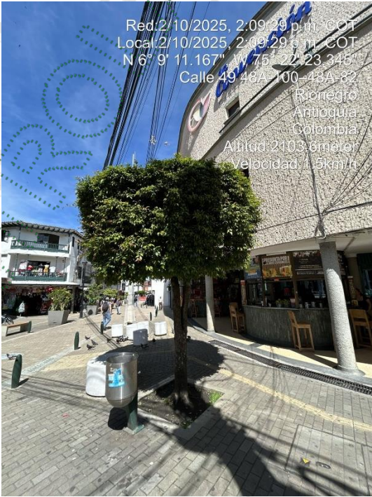
Imagen 3 y 4. Arbol a intervenir

4.1 Viabilidad: Técnicamente se considera VIABLE el APROVECHAMIENTO FORESTAL DE ÁRBOLES AISLADOS POR OBRA PÚBLICA , en espacio público en zona urbana del municipio de Rionegro, para la siguiente especie: