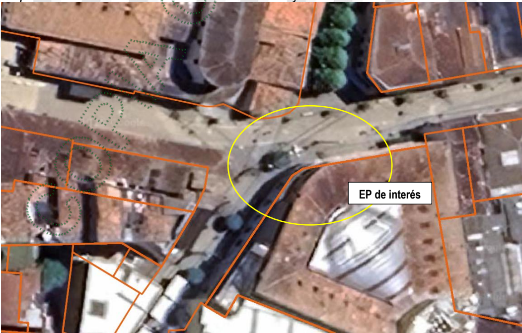
Imagen 1. Ubicación sitio de interés

3.2 En cuanto al sitio donde se ubica el árbol de interés: Hace parte del espacio público del municipio de Rionegro, correspondiente a una acera al frente del centro comercial La Convención a una cuadra del parque principal. El objetivo del aprovechamiento es despejar la zona para el establecimiento de busto de homenaje.