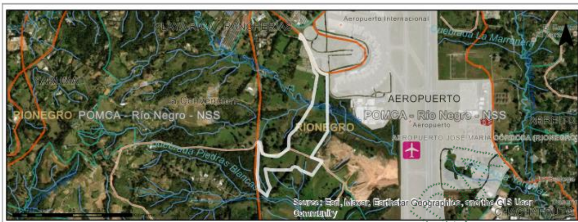
Imagen 1. Ubicación del predio de interés