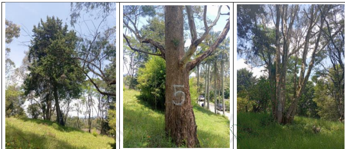
Imagen 3. Árboles objeto del aprovechamiento