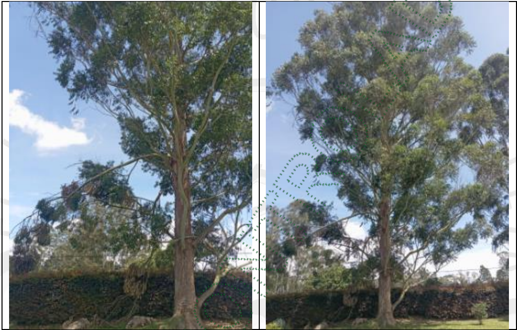
Imagen 3: Árboles objeto del aprovechamiento

4.1 Viabilidad: Técnicamente se considera VIABLE el APROVECHAMIENTO FORESTAL DE ÁRBOLES AISLADOS , en beneficio del predio identificado con el Folio de Matrícula Inmobiliaria 020-184074, Casa No 3, Parcelación La Pradera, localizado en la vereda Quirama del municipio de Rionegro, para las siguientes especies: