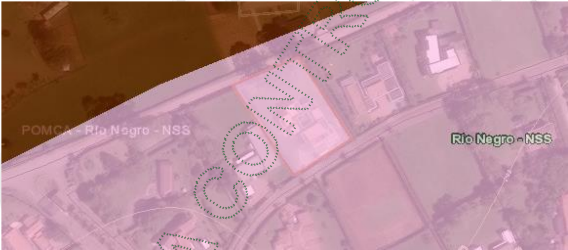
Imagen 2: Zonificación ambiental del predio según el POMCA.

Áreas de recuperación para el uso múltiple , en estas áreas, el desarrollo se dará con base en la capacidad de usos del suelo y se aplicará el régimen de usos del respectivo Plan de Ordenamiento Territorial (POT); así como los lineamientos establecidos en los Acuerdos y Determinantes Ambientales de Cornare que apliquen. La densidad para vivienda campesina será la establecida en el POT y para la vivienda campestre según el Acuerdo 392 de Cornare.