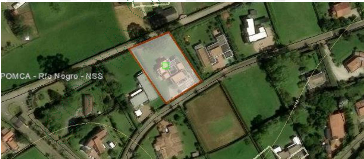
Imagen 1: Ubicación del predio de interés

En relación con los predios de interés: De acuerdo con el Sistema de Información Geográfica de Cornare, el predio de interés con Folio De Matrícula Inmobiliaria No. 020-184074 y PK 1482001000006300640, un área de 0,25 ha, corresponde a la Casa No 3 de la Parcelación La Pradera, se ubica en la vereda Quirama, del municipio de El Carmen de Viboral. El Predio presenta coberturas en pastos arbolados con una construcción (casa campestre), con un paisaje de altiplanicie y relieve en terrazas y abanicos de terrazas. (Imagen 1.)