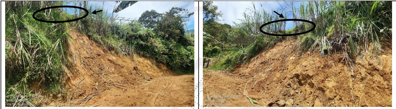
Imágenes 1 y 2. Movimiento de tierras para adecuación de vía de acceso. Cornare 2025