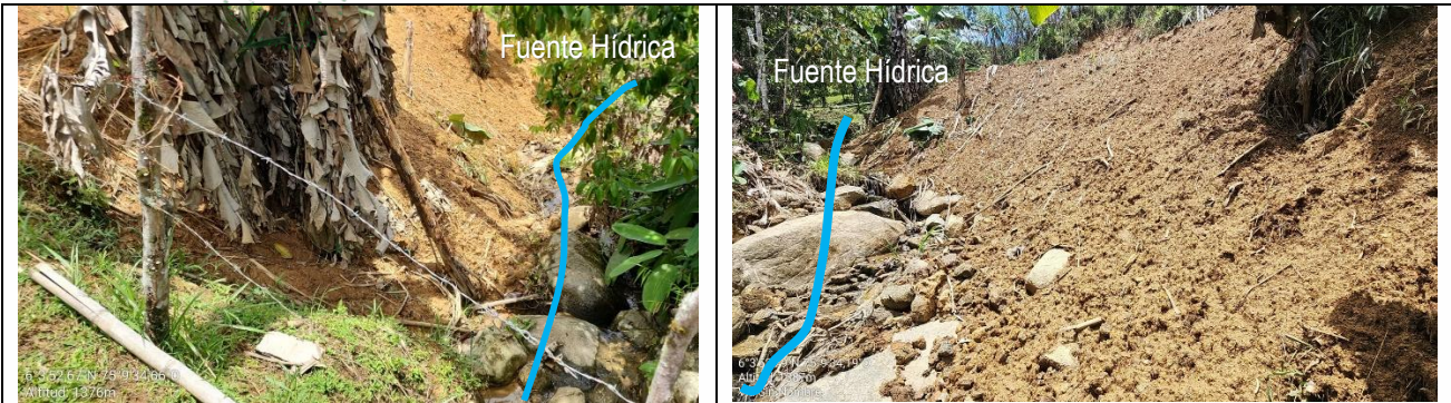
Imágenes 3 y 4. Sedimentación de fuente hídrica contigua al movimiento de tierra. Cornare 2025