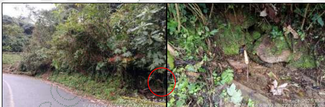
Nacimientos de agua