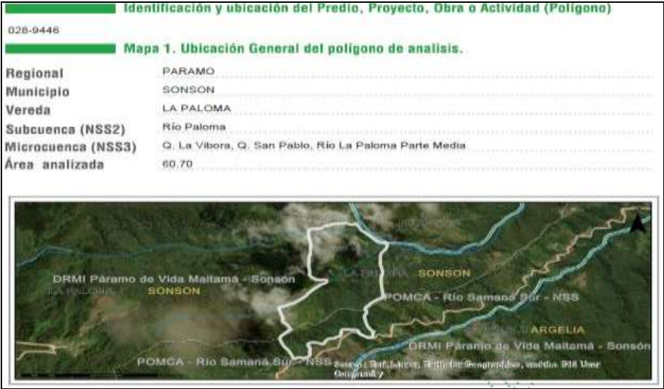
Ubicación predio F.M.I 028-9446

Durante la visita se ingresó al lugar ubicado en las coordenadas geográficas 5°41' 46.14" N – 75°12' 48,36" W, se realizó un recorrido por el predio, donde se observan troncos de árboles cortados y derribados dentro del predio cerca de la vía, se identificó cuatro individuos de especie nativa, los cuales corresponden al ejemplar Guamo ( Inga edulis ), ejemplares jóvenes y adultos, con un diámetro que oscila entre 15 a 30 cm y altura entre los 3 a 5 metros de DAP (Diámetro a la Altura del Pecho)