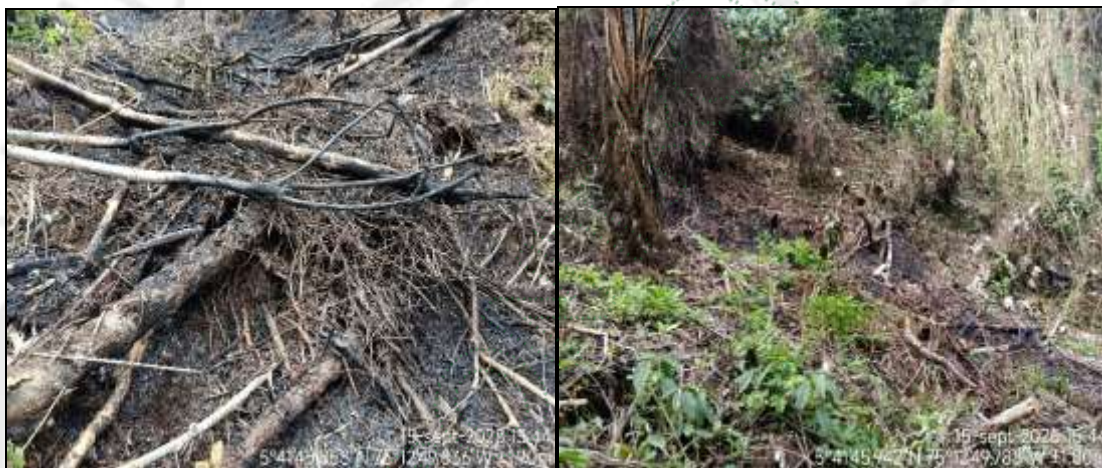
Sitio de la quema

En el sitio se evidencio rastros de quema de varios arbustos y árboles con una altura promedio de 0,5 a 1 metro en un área aproximada de 40 metros 2 . Por otro lado, en el predio donde se han realizados las afectaciones se encuentran un nacimiento de agua a unos 30 metros, el agua brota cerca de la vía principal.