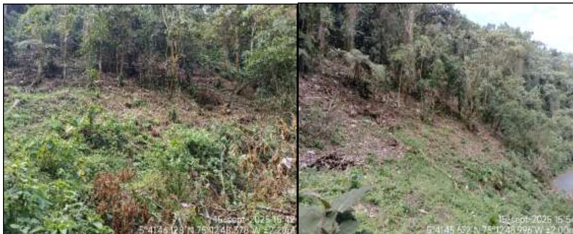
Área colindante al sitio de afectación

En el sitio se evidencio rastros de quema de varios arbustos y árboles con una altura promedio de 0,5 a 1 metro en un área aproximada de 40 metros 2 . Por otro lado, en el predio donde se han realizados las afectaciones se encuentran un nacimiento de agua a unos 30 metros, el agua brota cerca de la vía principal.