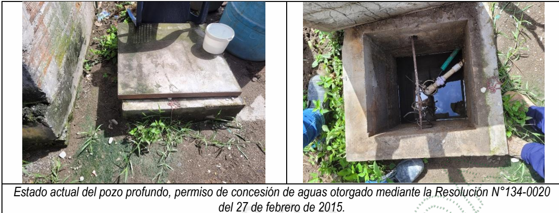
Estado actual del pozo profundo, permiso de concesión de aguas otorgado mediante la Resolución N°134-0020 del 27 de febrero de 2015.