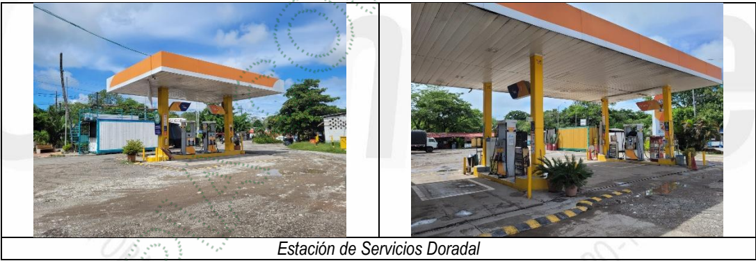
Estación de Servicios Doradal