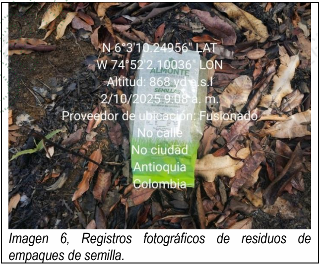
Imagen 6, Registros fotográficos de residuos de empaques de semilla.