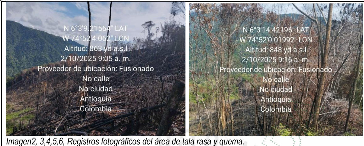
Imagen2, 3,4,5,6, Registros fotográficos del área de tala rasa y quema.