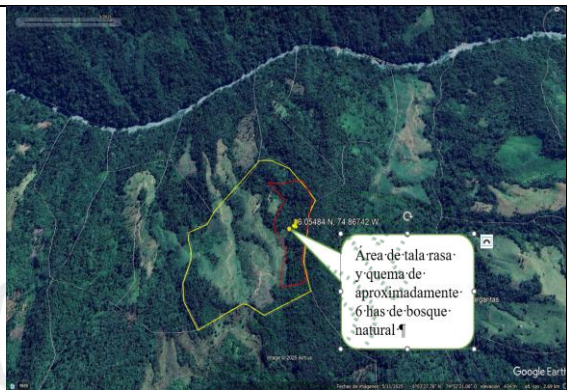
Imagen 8. Imagen satelital de las condiciones ambientales del predio año 2025, Fuente GOOGLE EARTH año 2025.