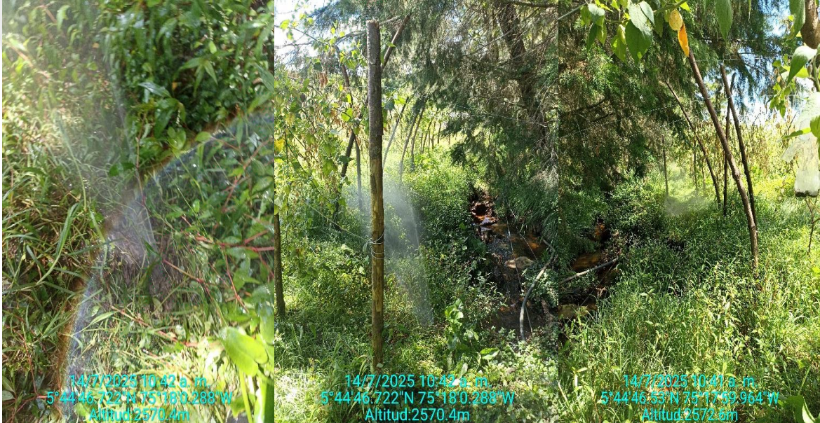
Fuga de agua por mangueras en mal estado y cultivo de uchuva muy cerca a la fuente.