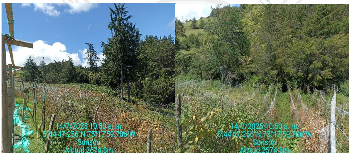
Cultivos establecidos en la ronda hídrica a lo largo de la extensión de la fuente