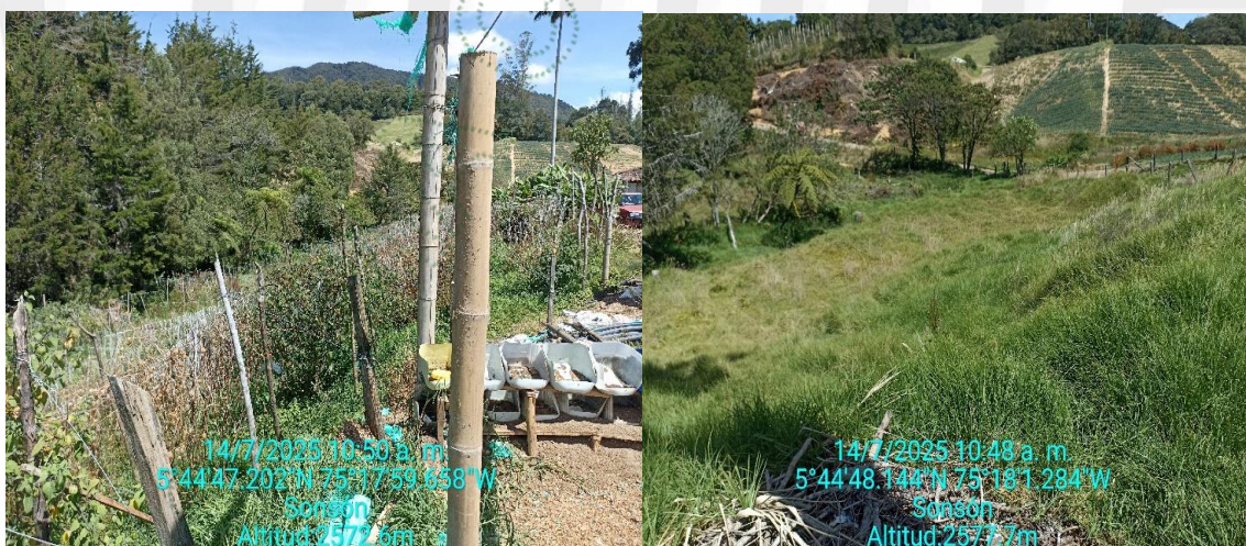
Cultivos establecidos en la ronda hídrica a lo largo de la extensión de la fuente