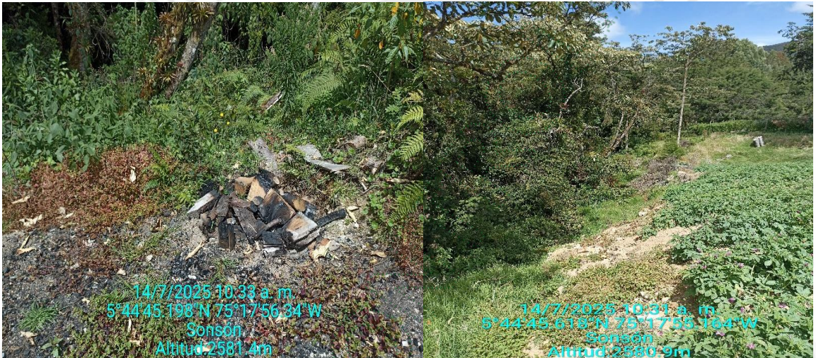
Quema de residuos y cultivos de Papas en la ronda hídrica