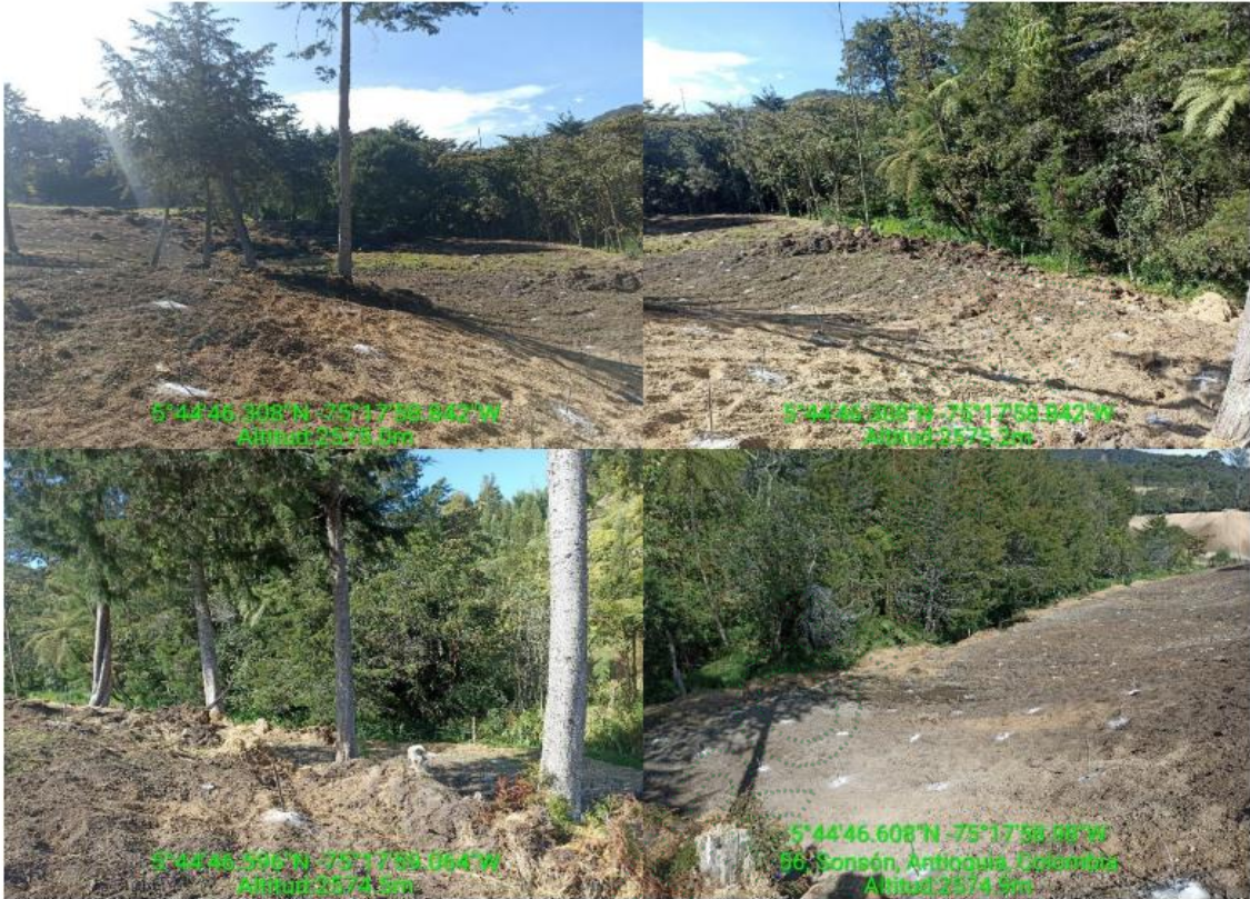
Quemas de residuos en el predio a 15 metros de la fuente hídrica: