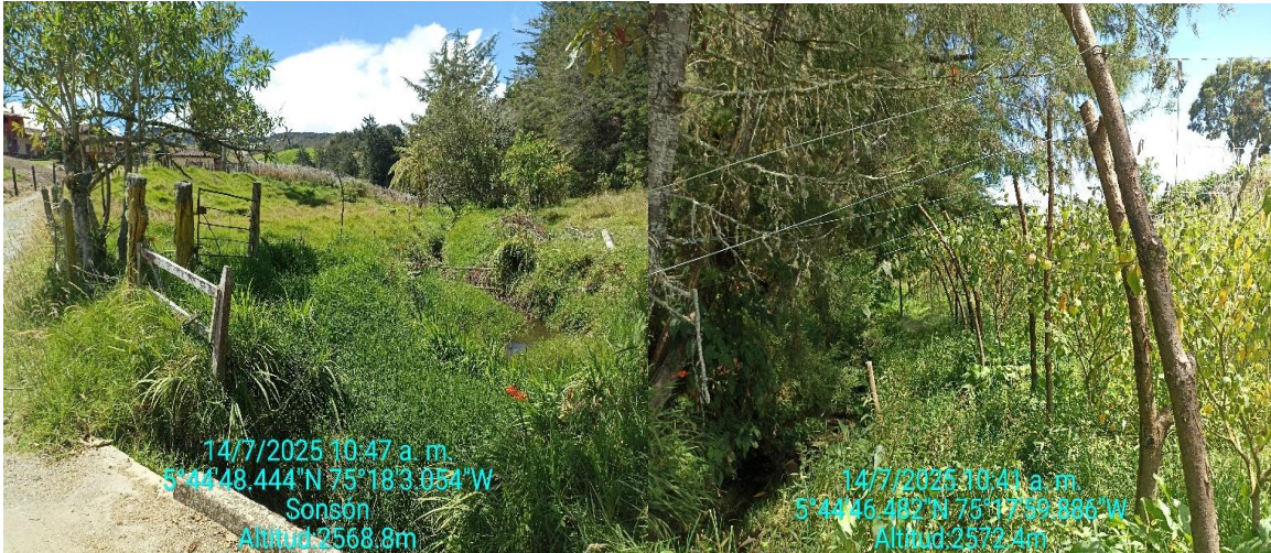
Zona de pastoreo y cultivos de Uchuva a menos de 2 metros de la fuente