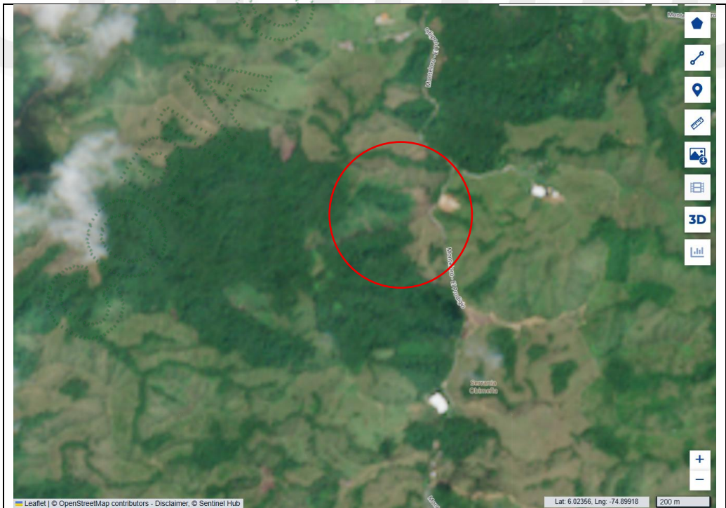
Imagen 3. Área intervenida de queja anterior. Exp. 056600341899, imagen del 24 de octubre del 2025.