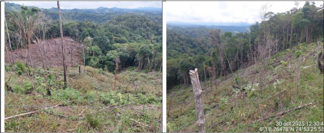
Imagen 3. Registro fotografico del área donde se realizó la tala.