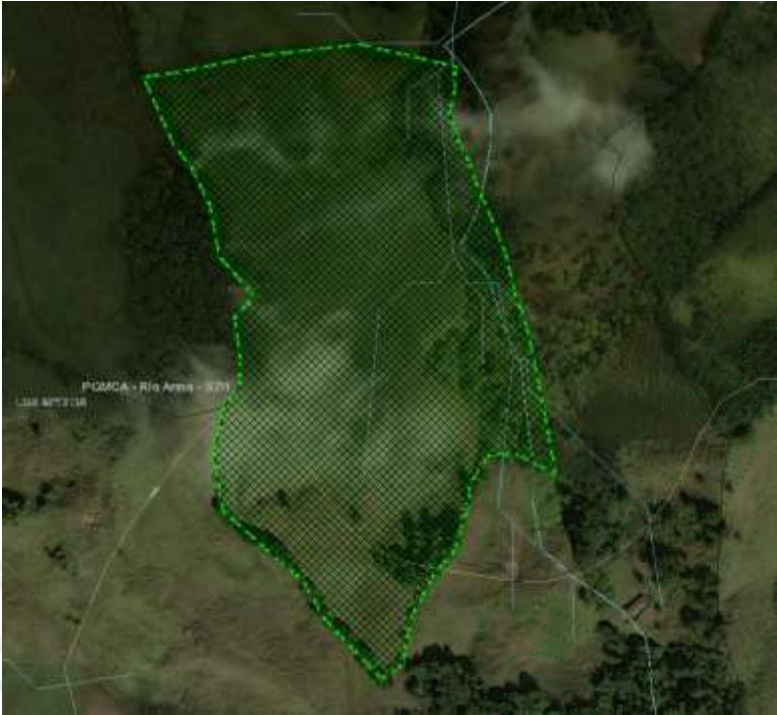
Imagen 1: Ubicación del predio.

Según lo observado en campo la vocación del suelo ha sido agrícola y en la actualidad se desarrolla actividad de cultivo de aguacate en pequeña escala, las actividades se desarrollan en áreas catalogadas como áreas agrosilvopastoriles, en el predio se observan varios relictos de bosque y retiros a fuentes hídricas las cuales están siendo conservadas.