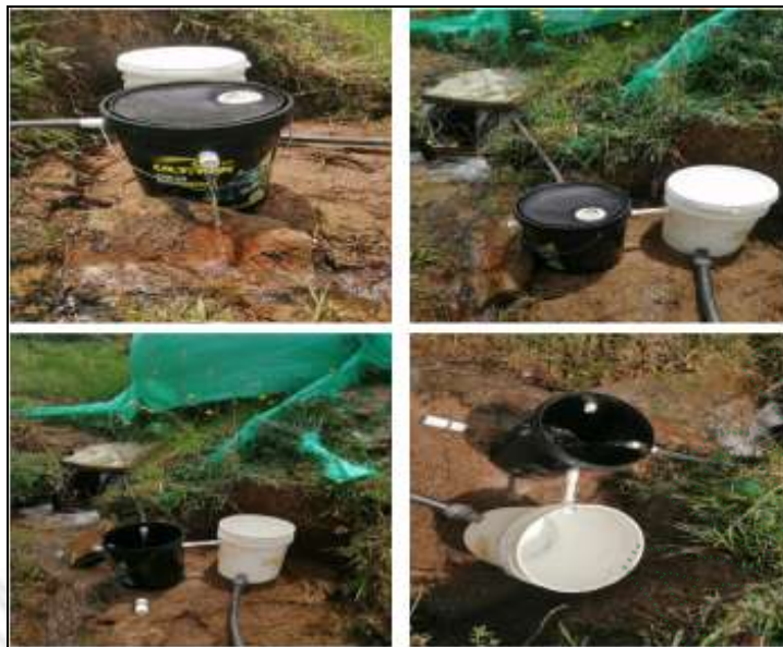
Ejemplo de obra control de caudal económica (diseño)