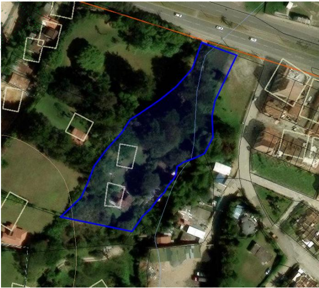
Imagen 1. Ubicación predio de interés

3.2 En cuanto al predio donde se ubican los árboles de interés: Se encuentra ubicado en la zona urbana del municipio de Marinilla, presenta un paisaje de altiplanicie con un relieve de terrazas y abanicos. El objetivo del aprovechamiento es prevenir accidentes por el estado de longevidad de los árboles y su cercanía con viviendas colindantes.