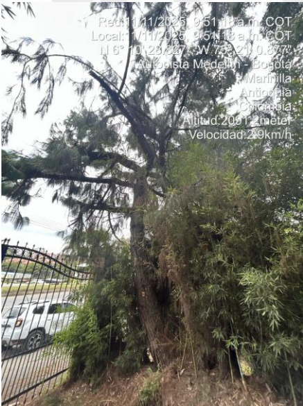
Imagen 3 y 4. Arboles a intervenir