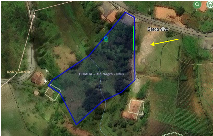
Imagen 1. Ubicación predio de interés

Conforme la solicitud y verificado en la visita de campo, el interesado manifiesta que requiere la autorización de diez y nueve (19) individuos de la especie Ciprés ( Cupressus lusitánica ) y un individuo de la especie Eucalipto ( Eucalyptus sp.), para un total de veinte (20) individuos.