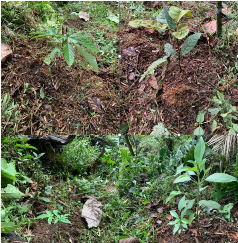
Figura 1. Compensación con siembra de especies arbóreas

En el sitio donde se realizó el aprovechamiento del individuo arbóreo, se efectuó la siembra de especies nativas como yarumo ( Cecropia sp.), guamo ( Inga sp.) y cedro ( Cedrela sp.), las cuales se encuentran en buenas condiciones de crecimiento y desarrollo. Esta actividad como medida de compensación ambiental orientada a la restauración de la cobertura vegetal y a la recuperación de las funciones ecológicas del área intervenida, contribuyendo así a la conservación del equilibrio del ecosistema local