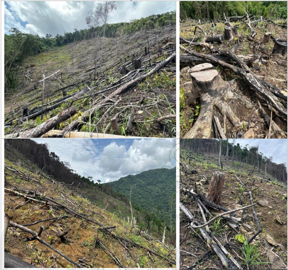
Tala y extracción de madera en el predio 6602002000001000026.