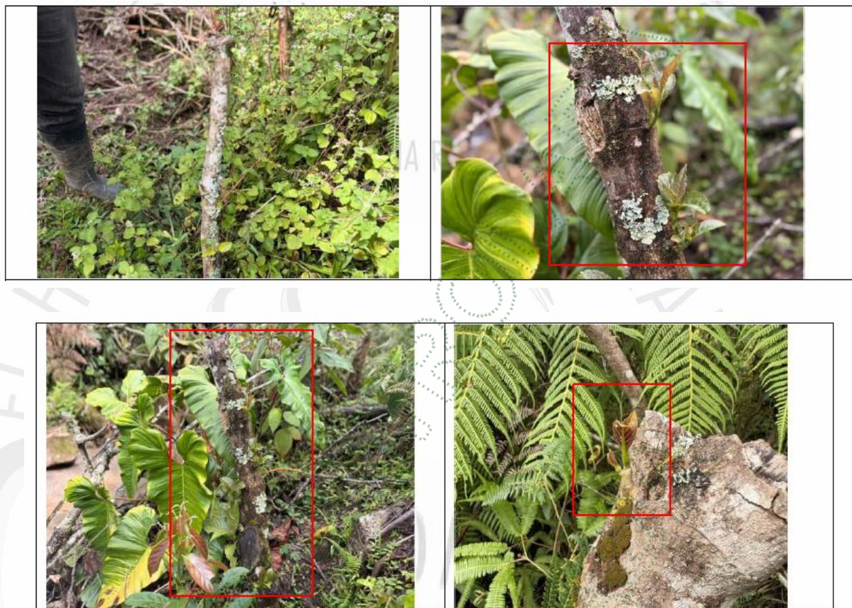
Imagen 1 – Siembra de Quebrada Barriga – Predio de Álvaro Herrera

- En relación con el ARTICULO TERCERO; materia de compensación, se evidencia lo siguiente: