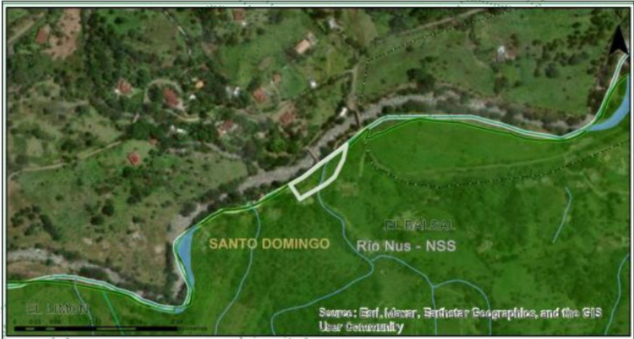
Imagen 5: Zonificación ambiental – Geo portal

En groso modo analizando las determinantes ambientales de esta área de interés, abarcando el predio del señor DAIRO DE JESÚS ORTEGA GONZÁLEZ , identificado con el número de ciudadanía N° 71.172.789 se determina que :