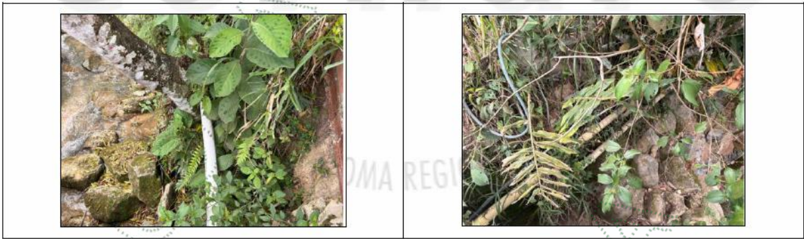
Imagen 4. Tuberías de viviendas en el sector – Descarga directamente al Río.