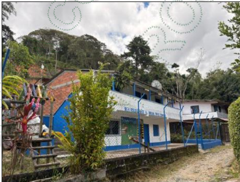
Imagen 3. Escuela J.A.C el balsal