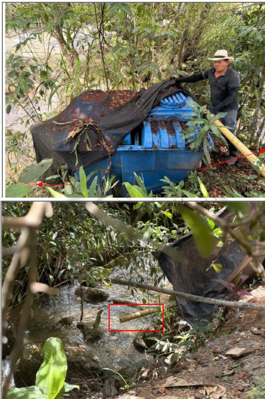
Imagen 2. Tuberías de duchas, cocina y lavados – Sin STARDs

Tras el primer encuentro con el señor Darío Ortega, nos dirigimos al sitio donde el tiene instalado el pozo séptico de material plástico. Este pozo séptico esta ubicado con las siguientes coordenadas: -75 6 38.74W 6 32 10.18N.