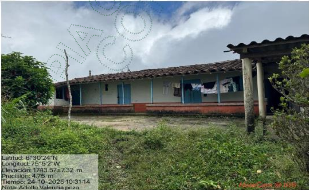
Imagen de la vivienda