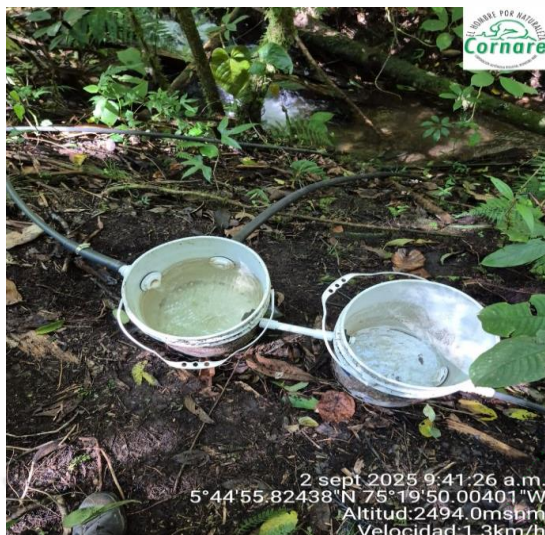
Imagen 3. Obra de captación y control de caudal fuente El Calvario