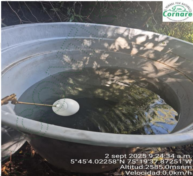
Imagen 2. Tanque de almacenamiento 1000 litros.