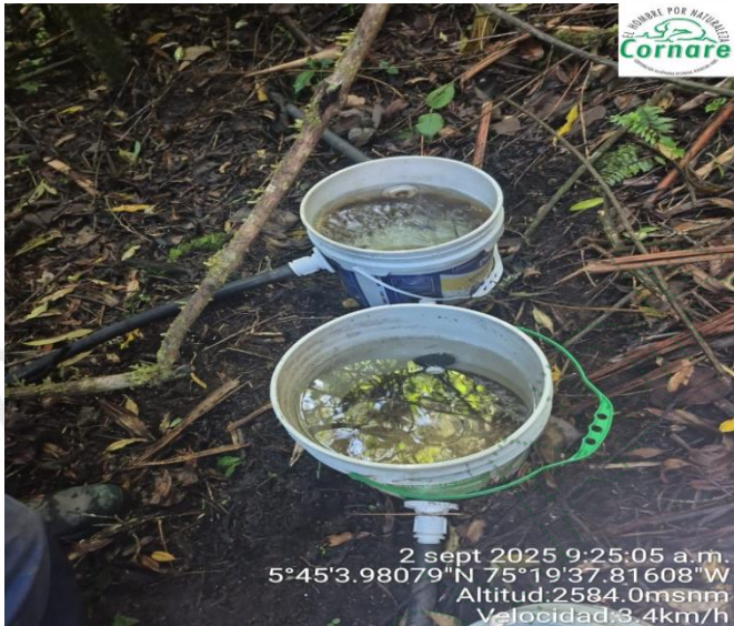
Imagen 1. Obra de captación y control de caudal fuente El chucho

Fuente El Chucho: tanque de 1.000 litros, destinado a riego y uso doméstico. Fuente El Calvario: tanque de 250 litros, destinado a uso doméstico.