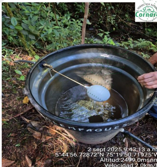
Imagen 4. Tanque de almacenamiento de 250 litros.